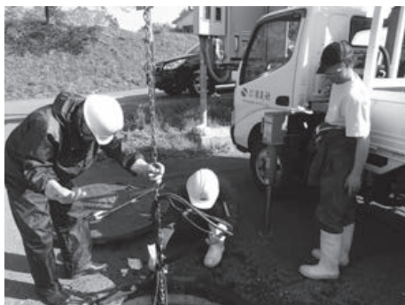
▲ポンプ引き上げ作業

下水道ポンプが緊急停止すると、汚水がマンホールから溢れることがあります。緊急停止するたびに作業員が出動し、ポンプ本体を引き上げ、異物の除去をしています。