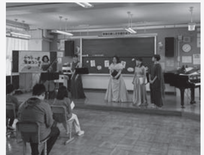
▲余部小学校でのコンサート

町教育委員会では、今後も引き続きクラシック音楽の普及に努め、地域の文化芸術の振興を進めて、豊かで活気ある地域づくりに取り組みます。