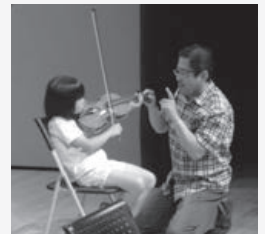
▲さあ、音を出してみよう