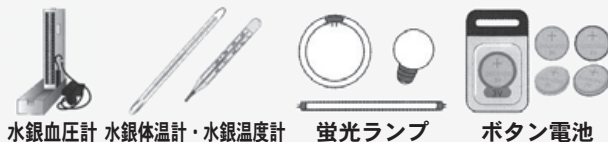
水銀血圧計 水銀体温計・水銀温度計 蛍光ランプ ボタン電池