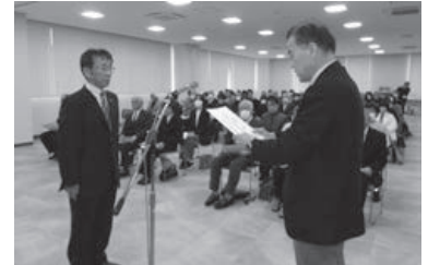
▲昨年 12 月 11 日、浜上町長から委嘱状が伝達されました

皆さんの身近な相談相手として、また行政とのパイプ役となって地域福祉、児童福祉を担います。