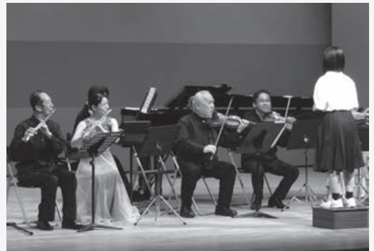
▲プロの演奏家たちの音を操る指揮体験

翌日の28日には、一般の人を対象としたコンサートと楽器体験会を開催しました。これは「聴く（受動的）」ことから「演じる（能動的）」への展開を期待して企画したものです。フルートとバイオリンそれぞれに分かれて体験会を開催し、楽器に触れる機会をつくりました。楽器に触れることを継続するために、昨年10月からは「はじめてのフルート・バイオリン講座」を開催し、合計9人が受講しています。