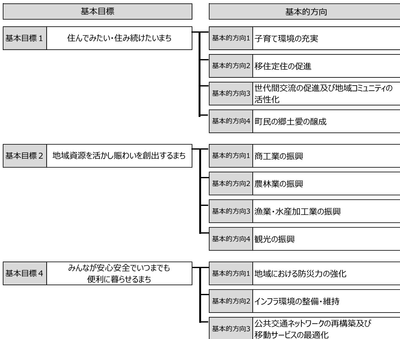
図表 1-2 重点施策：第 3 期香美町総合戦略の体系図