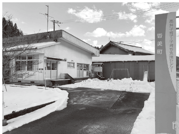
高井子育て・子育て支援センター

時代は、SNS、インターネットの急速な変化をひしひしと感じられるようになり、その重要性を強く感じる。