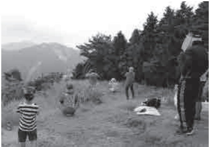
▲瀬川山の山頂から、鉢伏山で上がるのろしを探す参加者

瀬川山コースでは、10人が山頂へ到着。双眼鏡などを使って蘇武岳や鉢伏山から上るのろしを見つけると「あっ、見えた!」「よく見えてよかった」など歓声が上がりました。