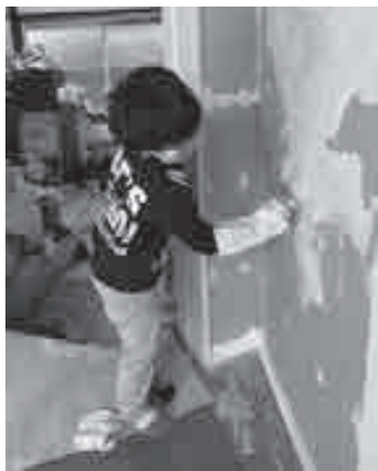
▲子どもと一緒にDIYした箇所も

刈りが趣味だからやってあげるよ」と優しく言ってくださり、申し訳ないやらありがたいやら、草刈り機の購入を急がねばと、これがリアルな里山暮らしなのかと満喫しています。 家の中は、元の家主さんが多くの荷物を捨ててくださったいましたが、押入れや天井裏の収納から打ち出の小槌のように後から後から荷物が出てきました。収納力がすごい家だというのはよく分かりました。 長く空き家になっていたことから、床はもちろん、柱や壁なども拭き掃除が必要でした。瓦や外壁も傷んできており、自分たちで直したり、プロにお願いしたりしています。 空き家の片付けと掃除を自分たちで経験してからは、仕事で空き家バンクを回っているときに家主さんが「家財が多くて、片付けが大変で…」とおっしゃられると、心の底から「分かります!」と相槌を打っています。 自分で空き家を買うことで、空き家バンクへの理解がより深まりました。