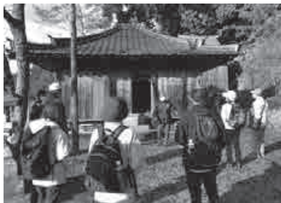
▲大糠の観音堂でガイドの説明を聞く参加者

町内には国指定文化財10件、県指定文化財24件、町指定文化財64件、国登録文化財1件、合計99件の指定・登録文化財があります。これらの文化財を大切に守り継いでいくためにいろいろな支援制度がありますので、指定等文化財の保存や活用についてのご相談は、生涯学習課までお問い合わせください。