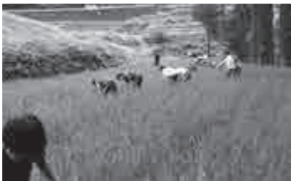
▼うへ山の棚田(全景)