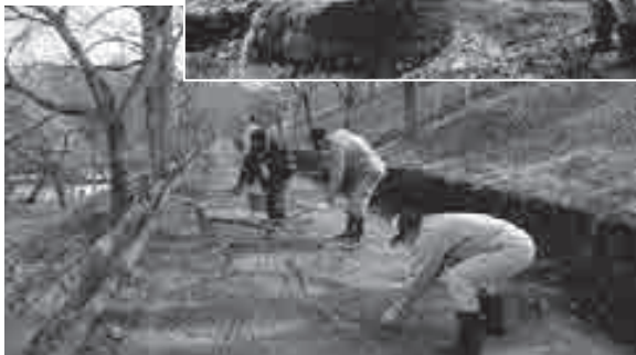
▲3月28日に行われた初回活動で、落ち葉や折れた枝を掃除しました。