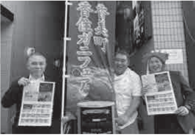
▲香住ガニフェア実施店のオーナー2人と撮影

今年度も引き続き神戸を中心に、商店街や飲食店と連携した企画を検討しつつ、新たなエリアの開拓を進めていきたいと思っています。