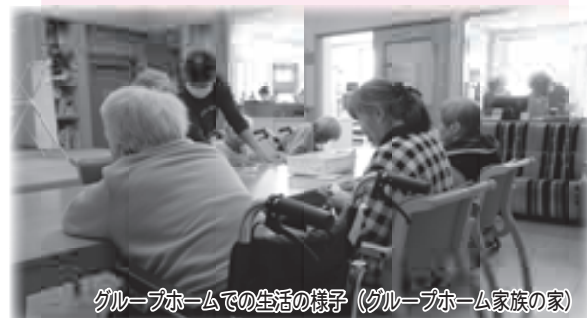
グループホームでの生活の様子（グループホーム家族の家）