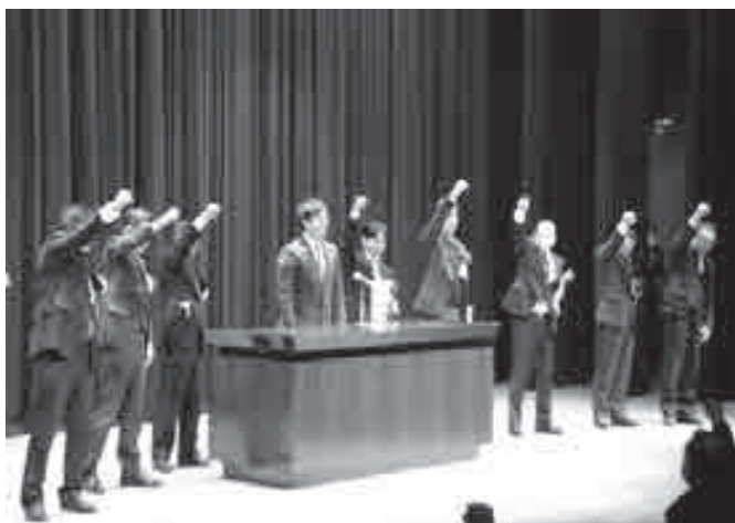
▲早期実現に向け頑張ろう三唱を行う関係者ら

大会で浜上町長は「町民が一丸となり、子どもたちの安全確保や地域の活性化を図るためにも、早期事業化を強く求め、本町の発展を推し進めたい」とあいさつし、参加者で頑張ろう三唱を行いました。