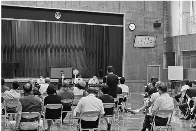
佐津小学校での懇談会