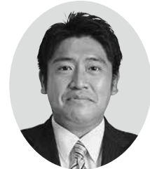
吉川 康治 議員