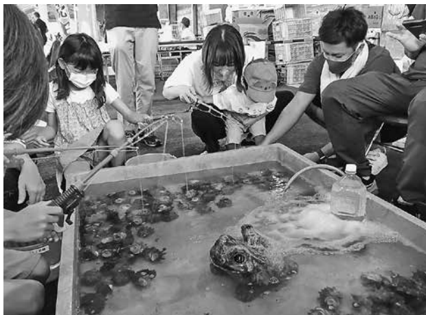
子どもの多いイベントは盛り上がる