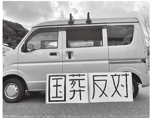
違憲の国葬は反対です