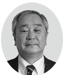
西川 誠一 議員