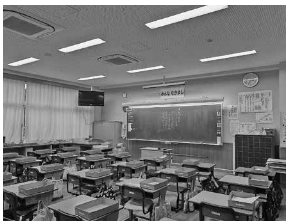
明るい照明の教室