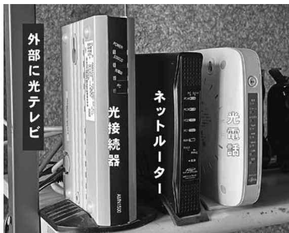
デジタル社会に必要な不可欠な高速通信網