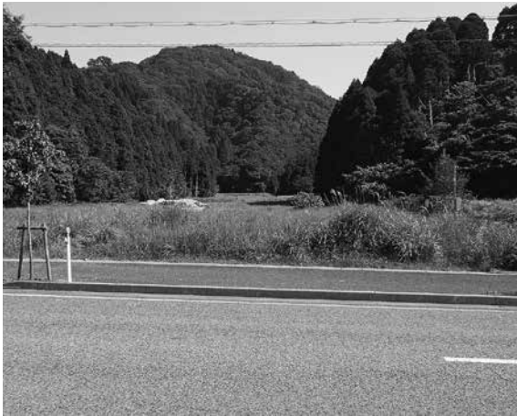
防災センター候補地