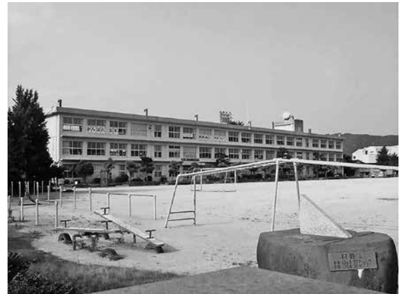
私が過ごした香住小学校舎