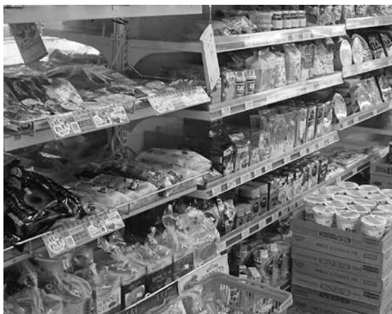
食品値上げ困ります