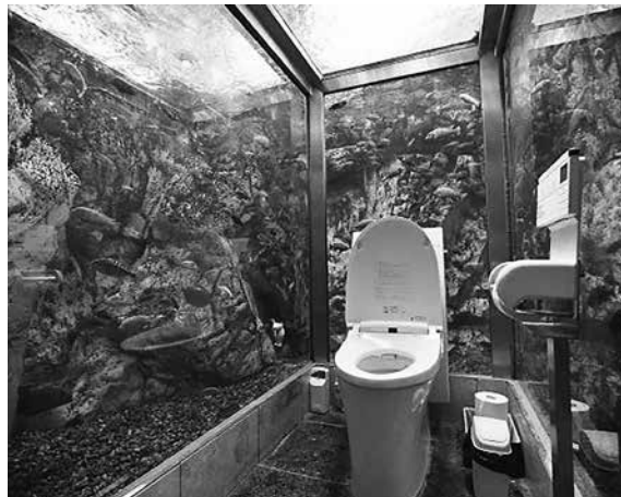
観光名所としても