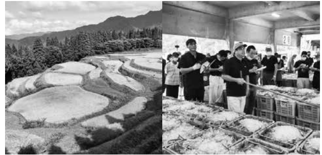
うへ山の棚田の稲刈り・香住ガ二のせり

戸配布し、住民に周知しました。ハード面は財源等で即時対応することができていない現状です。現状は防災の結果として減災・縮災につながるものと考えています。防災センターは山手を候補地として、防災力向上のため検討中です。避難路は区長さんに見直し等の対応をお願いし、検討します。