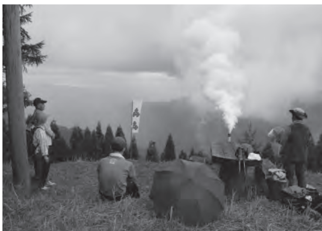
▲二蓮寺山頂から立ち上る狼煙を見守る参加者

小代区の二蓮寺コースでは、山頂から地図を見ながら方向を確認し、細く上がる狼煙を見つけると、「何とか他の山からの狼煙を見られてよかった」と歓声が上がりました。