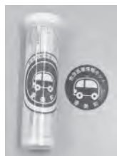
▲キットとステッカー