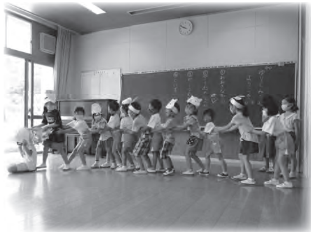
▲小学1年生と合同で取り組む演劇の様子（令和2年度）

その他にも、幼稚園の多くが小学校の併設園であり、合同での避難訓練や引渡し訓練の実施など密な連携を図っています。