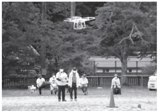
▲目標物をめがけてドローンを操作する参加者（射添会場）

射添会場に参加していた女性は「人が行けないところが見られるのがいい。なかなか真っすぐ飛ばすのが難しいですね」と笑いながら話していました。