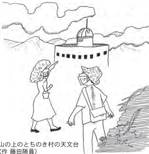
山の上のとちのき村の天文台 (作 藤田隊員)