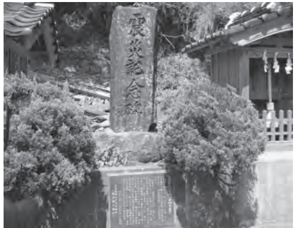
【豊岡市田結地区震災記念碑】

1925年北但大震災の際、消火活動を優先した住民の行動が減災の好例として知られている。