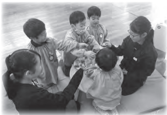
▲小学校の休憩時間を利用して遊ぶ様子（令和2年度）

取り組みの例として、給食を小学校と同じ時間に設定し、給食当番やエプロンの着替え、食事マナーの練習を行っています。その他、当番制による会の進行・連絡係や時間と場所を設定した掃除なども実践しています。また、正しい姿勢で座り、集中して話が聞けるよう指導しています。