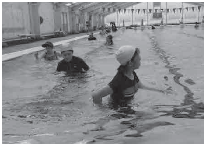
▲水の抵抗を感じながら大股で歩く参加者

香住区から参加した女性は「毎年参加しています。お友達と水の中を歩くのは楽しいし、良い運動になります」と話してくれました。