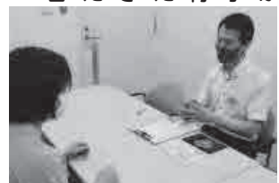
◀和やかな雰囲気の中で相談を受けられます

障害者などの求職者が登録した場合、まずは丁寧な聞き取りや面談を行い、それぞれに合ったマッチングを進めていきます(求人開拓をするため事業所訪問をする場合もあります)。