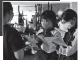
▲スタッフさんにインタビュー