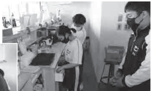
▲来客があると飲み物を準備します。