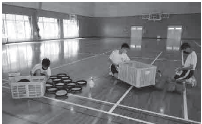
▲きれいに写ってるかな？ ▲ボールなどの道具をきれいに消毒しています。