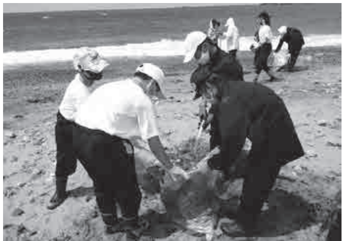
▲漂着したごみや流木を集める香住第一中学校の生徒

当日は、学校関係者に加えて香住青年会議所や香住観光協会、七日市市民など地域住民も参加し約2時間ほど清掃作業に汗を流しました。多くの漂着ごみがあった海岸は、「海岸をきれいにしたい」という一致団結した活動により見違えるほど美しくなり、生徒たちも晴れやかな表情を浮かべていました。