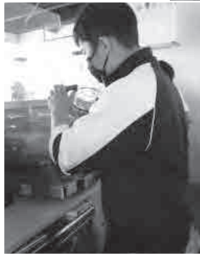
▲器具がきれいかチェック