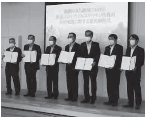
▲1市6町の首長による協定締結式の様子

この協定は、生活圏を共有している麒麟のまち圏域の1市6町（鳥取市、岩美町、若桜町、智頭町、八頭町、香美町、新温泉町）において、共同で新型コロナウイルス感染症に係るワクチン接種を実施することで、安心して円