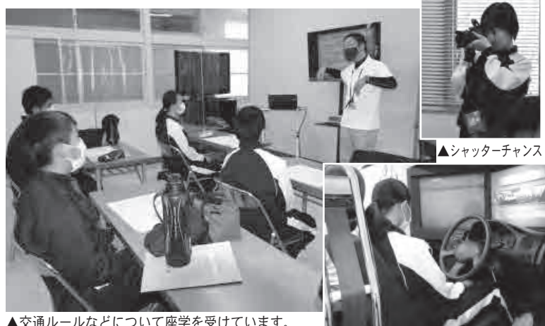
▲交通ルールなどについて座学を受けています。