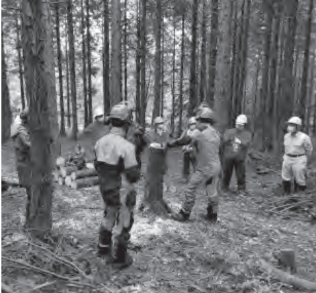
▲伐倒講習会の様子

まり見かけなかった若い人たちの新規登録もあり、以前より知名度も出てきているのではないかと思います。また、YouTubeチャンネルを開設し、講習会の様子や香美町の風景などを投稿する試みも始めました。平成31年の4月に地域おこし協力隊として大阪から香美町へ移住してきて協力隊としての3年間の任期も残すところあとわずかとなりました。思い返すと本当にあつという間の3年間でしたが、木の駅プロジェクトが今より少しでも認知度を上げられるように最後までしっかりと活動を行っていききたいと思えます。