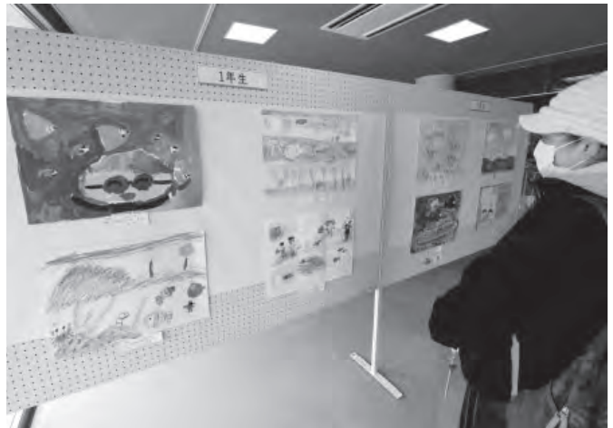
▲個性豊かな海の絵に見入る来館者

大阪府東大阪市から同館に来ていた女性は「子どもたちの絵に対する真心や命の大切さを感じ、感動しました」と感心していました。