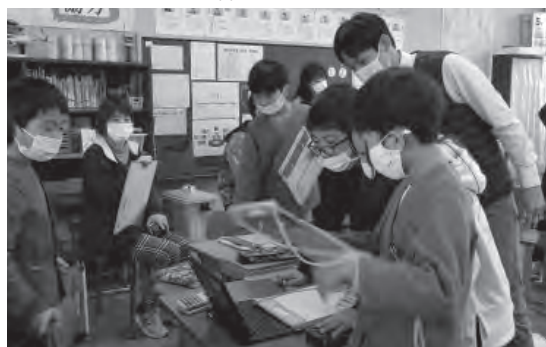
▲5年生・友だちが作成した問題に挑戦する