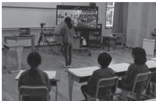
▲5校間をつなぎ自然学校での学びを共有

しかし、コロナ禍の影響により多人数で集まることができなくなったため、チャレンジAグループ（奥佐津・佐津・柴山・長井・余部小）では、自校からWeb会議システムを活用し、学校間でテレビ会議を行いました。1～4年生の各学年では、モニター越しにお互いの顔を見ながら自己紹介をして交流したり、各学校独自の行事や取り組みを発表しました。5年生では、自然学校の最終日に5校間で「思い出ベスト3」を発表し、自然学校で学んだことの振り返りを行い、6年生では2～3校間で「5校連合修学旅行報告会」を行いました。モニター越しの交流でも相手を意識し、分かりやすく伝えるよう発表を工夫して意見交換を行うことができました。