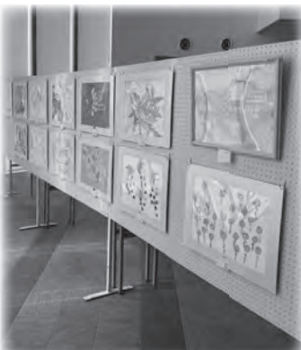
絵画や写真、木工のほか、楽器演奏のCDなども展示されました。

展示した作品の中から、町自立支援協議会長賞、香美町長賞、社会福祉協議会長賞の3賞が選ばれました。