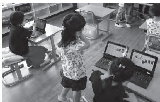
▲1年生・デジタル手書きツールで問題作成

このような取り組みにより、子どもたちの「調べたい」「まとめたい」「伝えたい」といった思いは、タブレット端末導入以前と比較し高まったように感じています。