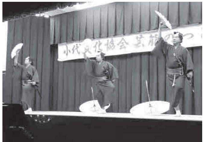
▲舞踊を披露する新屋芸能同好会のみなさん