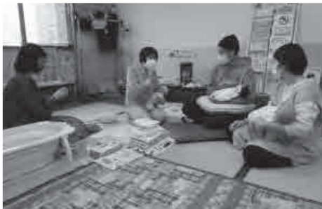
ミルクの作り方や、人形を使って授乳の姿勢などを実演します。また、相談なども和やかな雰囲気を受けられるよう心がけています。