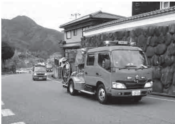
▲区内を巡回する香美町消防団小代支団の消防車両

当日は、火災の消火訓練を実施したあと、今年の防火標語である「おうち時間 家族で点検 火の始末」を呼び掛けながら区内の各地区を巡回。真っ赤な消防車両が1列になって道路を走る様子は圧巻で、沿道からは子どもたちが手を振り、声援を送る場面も見られました。