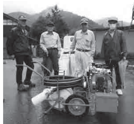
▲新しく購入した軽可搬消防ポンプ