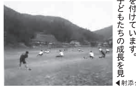
◀射添グラウンドで準備体操

これからも、子どもたちの成長を見ながらコーチングを続け、走ることを通じて人間的にも成長してもらえるクラブを目指して活動をしていきます。