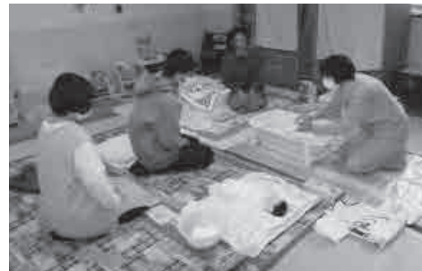
赤ちゃんの沐浴の仕方、人形を使った実演と体験形式で丁寧に教えます。また、必要な用品やあると便利なグッズなども紹介します。