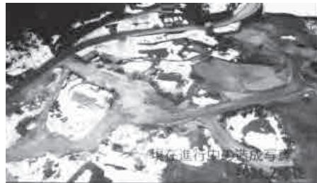
◀現在造成中の村岡区原の農地

最終の仕事ではないと感じるようになりまし。これからはその先にあるもの、誰の仕事を、農業にチャレンジし、誰でも働ける仕事場づくりを目指したいと思っています。