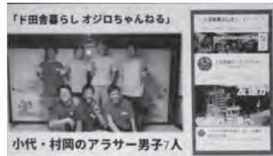
小代・村岡のアラサー男子7人

地元の人たちの多様な暮らしや楽しみ方を知ってもらうことが魅力を伝える上で必要となる中で、地域住民のできることのひとつが「発信」だと思っています。そして、たくさんの方の「発信」の積み重ねが暮らしのイメージづくりにつながると思っています。