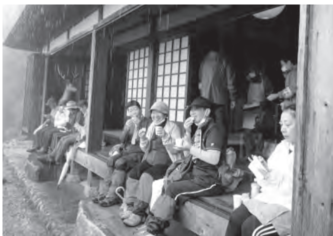
▲休憩棟の軒先で「但馬牛焼き」を食べる参加者

休憩棟に到着すると、板仕野区の有志の人たちから、地元産の米粉を使って牛の形に焼いた、たい焼きのような「但馬牛焼き」などが振る舞われ、参加者たちは「温かくておいしい」と心も体も温まるもてなしに感謝していました。