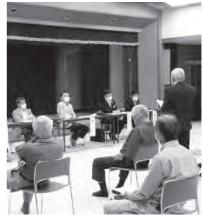
▲参加者の意見を聞く浜上町長(村岡会場)