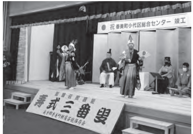
▲久保井講堂ステージで舞われた寿式三番叟の様子

真新しいステージで演じられる迫力のある舞を間近で体感し、式典参加者は真剣に見入っていました。