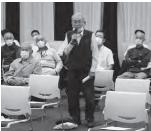
▲町長に質問をする参加者 (小代会場)

公共交通の関係につきましても、モデル地域を作ったり運営を減免したりさまざまな手法をとっています。過去に行ったアンケート調査では、どんなに便利になってもバスに乗らないと回答された住民が9割くらいおられます。このような結果が出ている中で、皆さんが利用できる体制づくりをしても利用していただけない状況と、国道9号を跨ぐために路線バスと町民バスとの並走運行ができず、香住に直接行けない状況に苦慮しております。町民バスとは別の方式で、小代区内だけに特化した公共交通はできませんが、他地域への交通手段の構築は大変難しいこととなります。(町長)