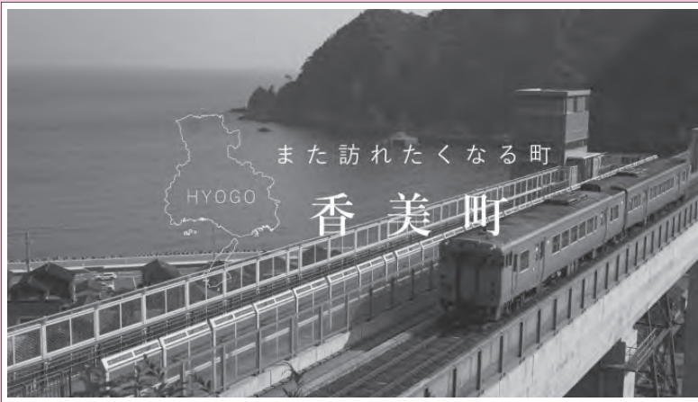
また訪れたいくなるまち (奈良県 今福彩夏氏)