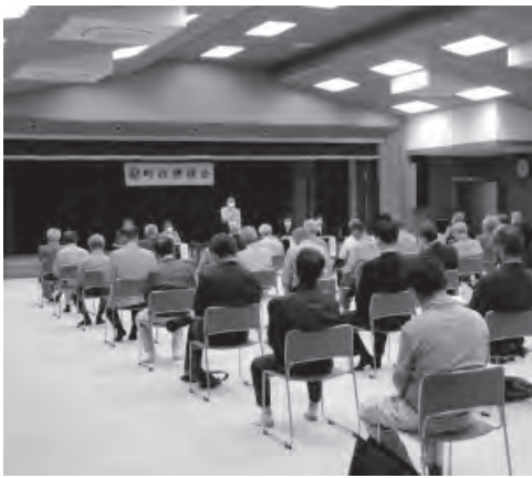
▲参加者で満員となりました(村岡会場)

新しく作った農業機械の購入に対する支援策は、認定農業者や法人化した組織などに対し、今までより補助率を上げ、耕作放棄地をできるだけ発生しないように取り組んでいただく事業です。個人が購入する機械を対象とすると、他の産業、職業で頑張っておられる人との整合性が取れませんので、そうした支援策は町では考えていません。(町長)