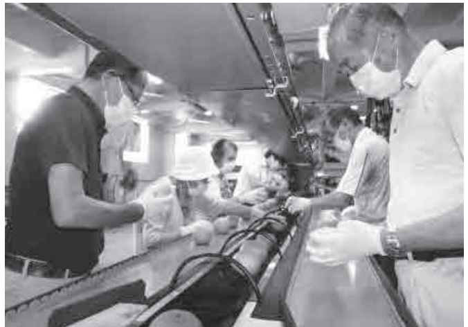
▲ベルトコンベアから流れてくる梨を仕分ける農家ら