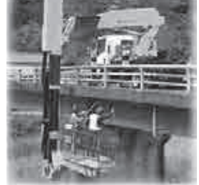
高津大橋の点検を実施

住民生活の利便性と安全性を確保するため、道路施設の計画的な点検および修繕を実施しました。