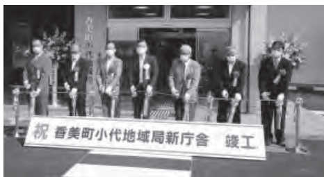
新庁舎の玄関前でテープカットを行いました。