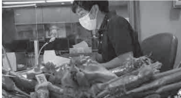
▲ラジオ関西で香住ガニの特集が放送されました。

あるラジオ局の（憧れの）女性アナウンサーにご挨拶させていただいた際、私が向けた名刺に対し、明らかに下から差し出されました。新任時研修で学んだ、遠く消え去りかけていた記憶がよみがえると同時に、戸惑いとうれしさ、また年齢差（私よりはるかに若い）から、恥ずかしさもあり、マスクの下は赤面と冷や汗。恥ずかしい失敗談ながらも、心温まる経験としてご紹介しました。これからも応援したいと感じるアナウンサーさんでした！