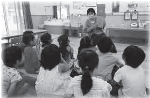
▲乳幼児期からの読み聞かせ（宝樹保育園）

乳幼児期からの絵本の読み聞かせを重点的に行うとともに、本に出会い親しむため、乳幼児健診、保育所、こども園などに出向き、年齢に応じた「おすすめの本一覧」を配布し、本にふれ合う機会を作るなど、発達段階に応じた読書活動を推進し、生涯を通じた読書による知識習得の習慣化を図ったり、判断力、想像力の基礎を培っています。