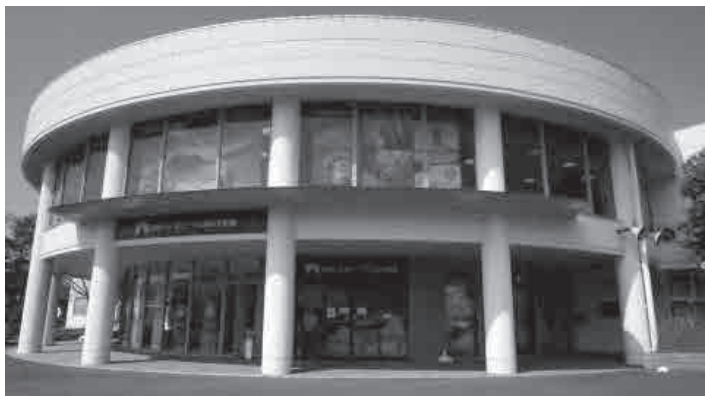
▲ジオパークと海の文化館