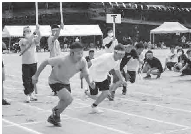
▲勢いよくスタートダッシュするブロック対抗リレーの出場者

新型コロナウイルス感染症対策で午前中のみ開催となりましたが、リレーや綱引き、小代っ子太鼓など計17種目の競技や演技に、子どもからお年寄りまでが世代の垣根を越えて参加。小代区内を地域ごとに4ブロックに分けて合計得点を競い、優勝を目指して楽しみながら全力を尽くしていました。