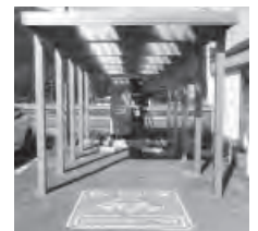
▲町内に設置されている EV スタンド

電気自動車は、排気がなく、クリーンなエネルギーで走る車でこの目標にかなった製品といえます。