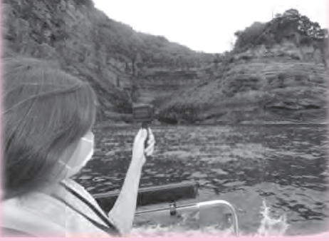
香住海岸のジオサイトを巡るかすみ海上GEO TAXI（ジオタクシー）

移住定住促進と関係人口拡大を図るため、住宅取得費・改修費に対する助成、空き家バンクの登録物件に対する補助などを行いました。