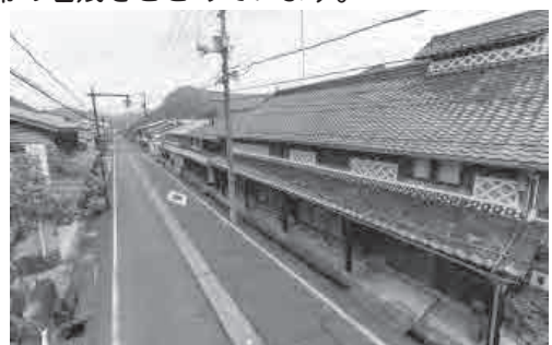
▲カリヤが残る本通り

本通りは、「若桜民工芸館」や「昭和おもちゃ館」などの施設を始め、多くの飲食店も集まる若桜地区の中心街です。通り沿いには、「カリヤ」と呼ばれる幅1.2mほどのひさが主屋と道路の間に設けられています。風雨や積雪の際は通行帯として利用されたといい、豪雪地帯の名残をとどめています。