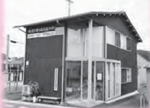
新築した香住観光案内所

令和元年度の少雪と新型コロナウイルス感染症の影響を受けたスキー場に対し、安定した運営を支援するため、スキーシーズン、グリーンシーズンのグレンデ利用のための設備導入などを支援しました。