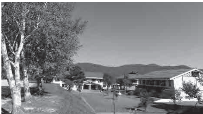
▲県立兎和野高原野外教育センター

●問い合わせ（提出）先 役場総務課 役場観光商工課 村岡地域局 兎和野高原野外教育センター TEL 0796・94・0211