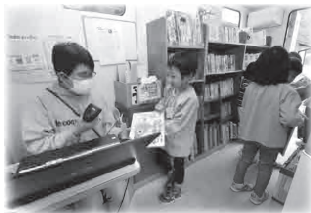
▲移動図書館車巡回（小代区図書館車 メルヘン 21）

読書機会を増やすため、村岡区では移動図書館車「やまなみ」、小代区では「メルヘン 21」の2台が毎月各地区を巡回しています。各地区の巡回のほか、移動図書館車で子育て施設などへ訪問し、図書の貸出やボランティアグループによる読み聞かせや紙芝居などを取り入れ、本に親しむ機会をつくっています。