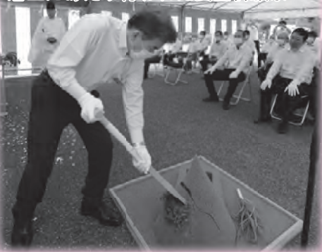
着工にあたり行われた安全祈願祭