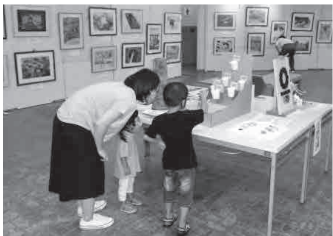
▲指さしながら「わぁ」と声を上げる来場者の親子

作品には、それぞれ子どもたちの思いやこだわりが書かれたカードが添付されており、展覧に訪れた人たちは「面白い」「すごいね」と話しながら、努力の跡が見える作品たちに見入っていました。