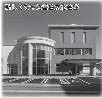
新しくなった香住文化会館