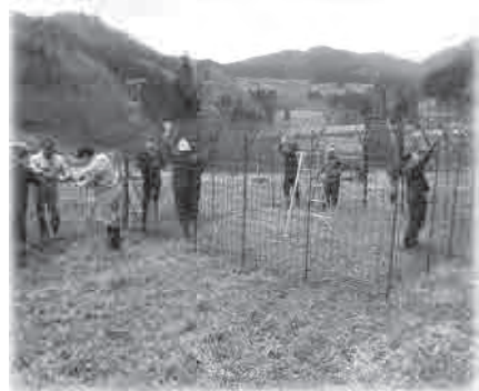
地域の人と協力して 獣害対策の捕獲檻を設置

地域の維持および活性化を図るため、地域再生協働員(小規模集落獣害対策員)を設置し、有害鳥獣対策業務を行いました。