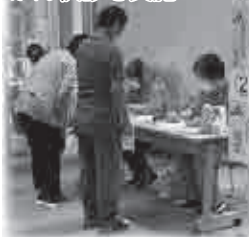
併せて健康とみぐる町がん検診を実施