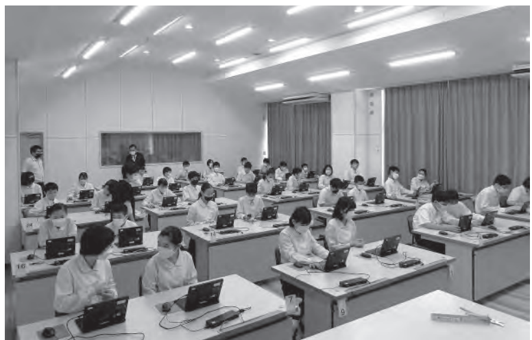
▲中学校・数学の授業の様子

学習者用デジタル教科書と併せて、ドリルなどの使用、動画の表示や、音声を繰り返し聞き聞ことができるデジタル教材を組み合わせることにより、何度も繰り返し学び、ペンやマーカーで書き込むことが可能となり、新たな気づきを発見し思考力を育むことができます。また、書き込んだ内容を瞬時に友だちと共有することができるため、友だちと違うところを見つけたり、自分の考えのポイントをマーカーすることにより相手に伝えやすくなります。