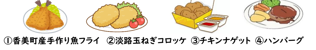
①香美町産手作り魚フライ ②淡路玉ねぎコロッケ ③チキンナゲット ④ハンバーグ

セレクト給食とは、自分が食べたいものを選んで食べられる給食の事です。今回は、カレーライスの日(24日)に4種類のおかずの中から好きなものを事前に選んでもらいました。子どもたちが何を選んだのかは、子どもたちに直接聞いてみてくださいね! 当日が楽しみですね♪