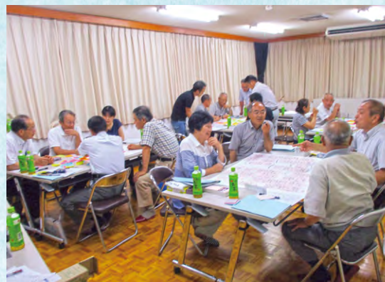
ワークショップ(射添公民館)