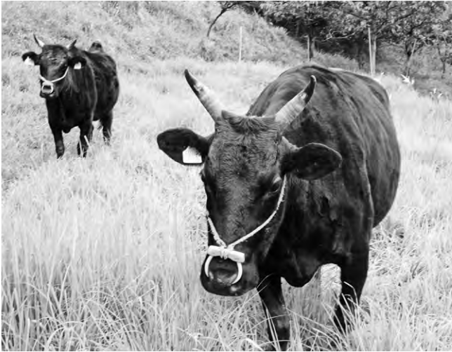
のびのびと放牧を