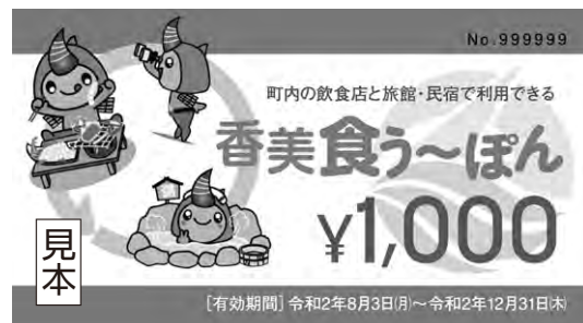
プレミアム付利用券