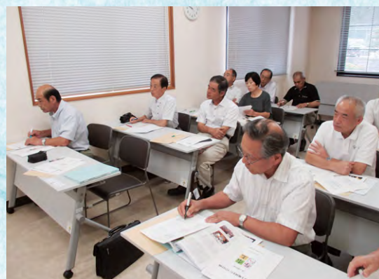
視察研修会(朝来市)

立準備委員会を発足しました。組織の目的、規約、組織体制、活動内容等について、十数回の準備委員会を開催してきました。