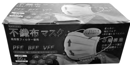
配布されたマスク(第2次)

問 プレミアム付利用券事業の①30%プレミアム効果②世帯単位の意味③使用対象の旅館等の「等」とは。④募集方法⑤利用券の販売方法は 答 ①プレミアム30%付利用券を町民に販売し、コロナ禍で影響のある飲食・旅館・民宿などの売り上げを支援することです。町の経済活性化を図ります。②乳児からお年寄りがある世帯を単位の購入限度額の設定③配食サービスなど小規模事業者も含めます。④町内事業者を広く公募します。⑤利用券は町職員が販売します。