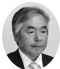
田野 公大 議員

コロナ禍において都会の密度の高さが弱点となることが顕在化した。高度情報化時代においては、もはや物理的距離の問題はほぼ解消され、地方への分散化の欲求が高まり、