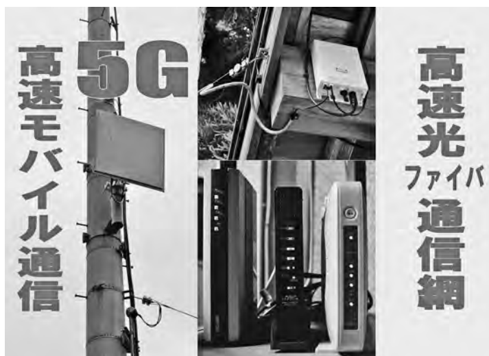
急がれる高速通信インフラ整備 (イメージ写真)

コロナ禍において都会の密度の高さが弱点となることが顕在化した。高度情報化時代においては、もはや物理的距離の問題はほぼ解消され、地方への分散化の欲求が高まり、