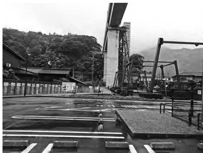
コロナ禍でひっそり（道の駅あまるべ）

は他の制度ではなく、人数分を賦課されます。子育て支援として考えられますが、財源を全町民に負わせます。他の保険の方には二重負担にもなり、税の公平性と子育て支援の点で、町の施策ではなく、国に支援制度として創設するよう、関係団体とともに要望を続けます。 尚、令和2年度の必要額は690万円程度との試算をしています。