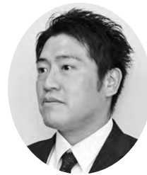
吉川 康治 議員

コロナ禍に限らず、災害時、どうしても庁舎が動けなくなる可能性も絶対に出てくる。住民の利便性や職員の安全・安心を考えると、コンビニでの行政書類の発行を早急