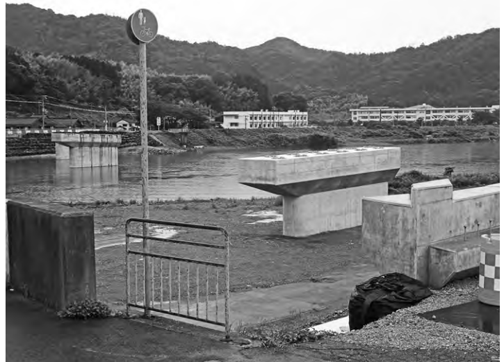
事業中(出水期休工)の矢田橋と香住高校