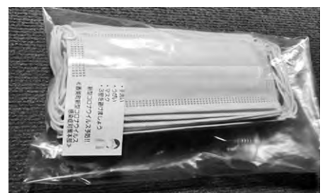
配布されたマスク(第1次)

問 町民と行政に危機、スピード感にズレがあるのでないか、国、県の制度との絡み、周知はどうか、1度きりの支援か、今後の支援は 答 町としては正確に早く、町独自の予算設定をしたつもりです。 問 国、県補助については5月臨時会で提案します。国、県へオンラインで直接申請するもの、町を通すもの等、申請が複雑ですのでワンストップ窓口を設置します。 答 またホームページ、臨時広報等で周知していきます。 問 今後、感染状況をみながら継続的に対応していきます。