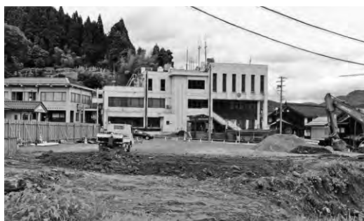
小代地域局 改築始まる

兵庫県後期高齢者医療広域連合条例の一部改正に伴い、町条例に「傷病手当金の支給に係る申請書の提出の受付」を追記