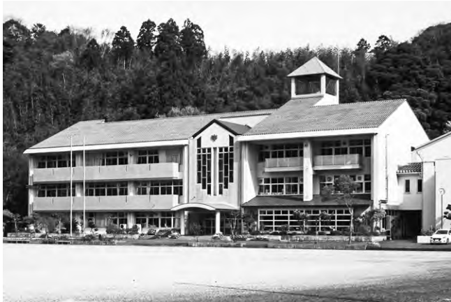
統合が決まった香住二中