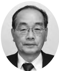
岸本 正人 議員