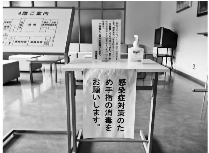
コロナ対策は長丁場!!