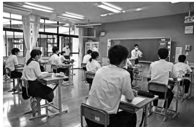
全履修に向けてgo！（小代中学校3年生）