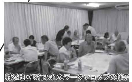
射添地区で行われたワークショップの様子

新しい地域コミュニティづくりの中心的な役割を果たす集落支援員の配置や住民アンケート調査を行ったほか、モデル地区における取組の推進を図りました。