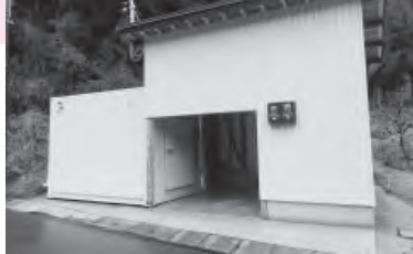
長坂に設置されたストックポイント

有害鳥獣対策として、町内2カ所に、捕獲したシカの一時冷凍保管施設（ストックポイント）を整備しました。