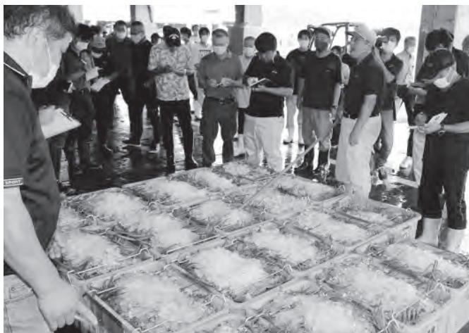
▲威勢のよい競り人によって競りにかけられる香住ガニ