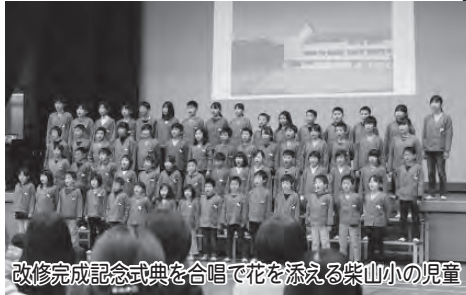
改修完成記念式典を合唱で花を添える紫山小の児童