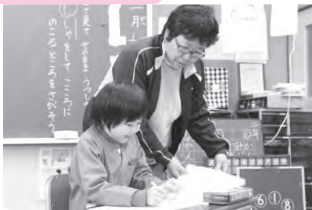
▲本町の学校園では、児童・生徒の発達状況や理解度などに応じた、きめ細やかな指導を行っています

本町には小学校 10 校・1 分校、中学校 4 校、幼稚園が 9 園ありますが、そのほとんどが小規模校であり、1 学級当たりの園児、児童・生徒数や教職員 1 人がかかわる園児、児童・生徒数が少なく、個別指導がしやすい教育環境にあります。このことを強みと捉え、一人一人を認め、育てる「個に応じた指導」を積極的に取り組むなど、学力の向上に努めています。