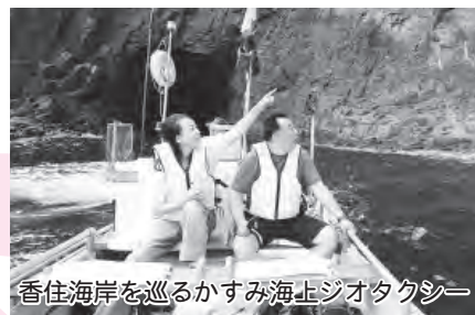
香住海岸を巡るかすみ海上ジオタクシー

山陰海岸ジオパークを生かした地域活性化に向けて、ガイド養成やセミナー、ジオバスツアーなどを実施しました。