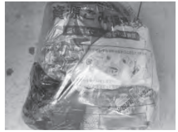
▲二重袋で出されたごみ