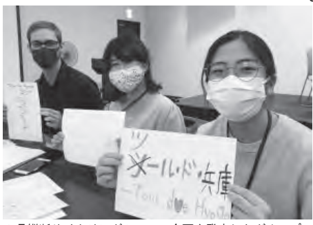
▲県縦断サイクリングツアーの企画を発表したグループのメンバーと

私の地域おこし協力隊としての任期も折り返しを迎え、卒業後自分は何をしたいのか、何が地域に求められているのかを考えるいきつかけとなりました。残りの任期は1年と少しですが、これからも地域の皆さまには色々サポートをお願いすることもあると思えます。 よろしくお願いたします。