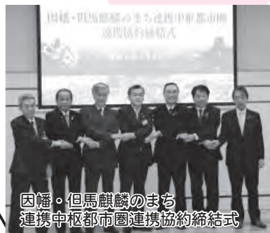
因幡・但馬麒麟のまち連携中枢都市圏連携協約締結式

生活圈や経済圏を一体とする自治体が互いの資源や特徴を生かし連携、協力する「因幡・但馬麒麟のまち連携中枢都市圏」に加入しました。