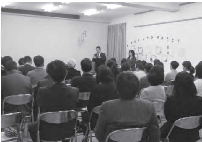
▲昨年の学校版教育環境会議の様子（余部小学校）

同会議は、各学校の教育に対するビジョンや方針、取組内容や実践活動などを説明し、参加者に校区の教育について理解していただくとともに、学校統廃合の必要性について確認をしています。「当該学校が魅力ある学校か」「地域の特色ある教育を行っているか」「信頼できるか」などの評価を受け、保護者や地域の皆さんが学校を高く評価し、信頼関係が続いている場合は、学校を存続させていくこととしています。しかし、出席者の 3 分の 2 以上が他校との統廃合を望ましいとし、統合すべきであると判断した場合は、町長に対し、当該学校の廃止について、書面によって意思表示を行うことになっています。