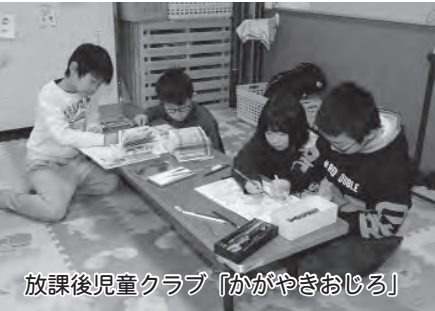
放課後児童クラブ「かがやきおじる」

児童の健全育成と子育て家庭の就労支援のため、放課後、仕事などで保護者が不在となる家庭の児童を預かる放課後児童健全育成事業を行いました。