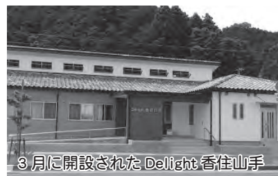
3月に開設されたDelight 香住山手

健やかに暮らせるまちづくりとして、健康教室・相談の開催や各種予防接種などに取り組みました。