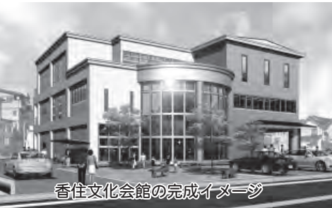
香住文化会館の完成イメージ

児童の健全育成と子育て家庭の就労支援のため、放課後、仕事などで保護者が不在となる家庭の児童を預かる放課後児童健全育成事業を行いました。