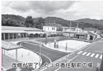
改修が完了したJR香住駅前広場

町道の安全性確保や橋の長寿命化を図るための計画的な点検や修繕などを実施しました。