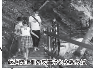
転落防止柵の設置された遊歩道