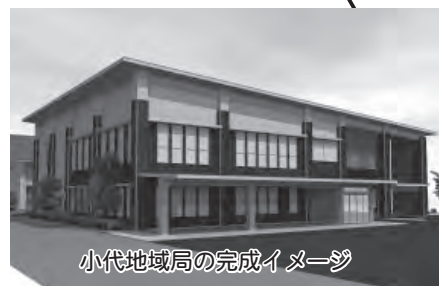
小代地域局の完成イメージ

移住定住促進と関係人口拡大を図るため、スタディツアーの開催や移住相談会への参加、ICT関連オフィス開設の支援、空き家バンク制度の運用などを行いました。