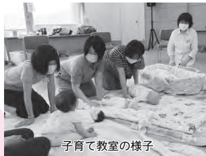
子育て教室の様子

結婚・妊娠・出産・子育ての切れ目のない支援として、妊産婦検診や健康教室のほか、訪問や相談業務を実施しました。