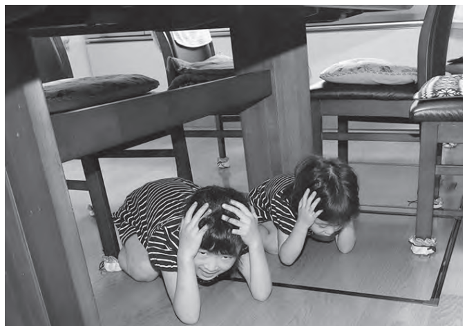
▲自宅の机の下で身を守る行動を取る子どもたち

その他にも各地区では、消火器や小型ポンプを使った訓練を行うなどし、防災意識を高めました。