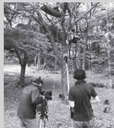
▲とちのき村でのツリーイングの撮影の様子(ぶらっと旅気分収録にて)

現在、eo光チャンネルが提供するインターネット番組「ぶらっと旅気分」で本町の夏の魅力が存分に紹介されています。9月17日(木)までインターネットで視聴できますので、ぜひご覧ください。