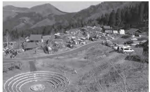
▲バンガローやオートキャンプを備えたキャンプ場