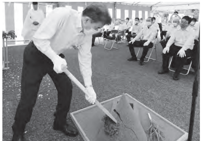
▲盛砂にくわ入れを行う浜上町長