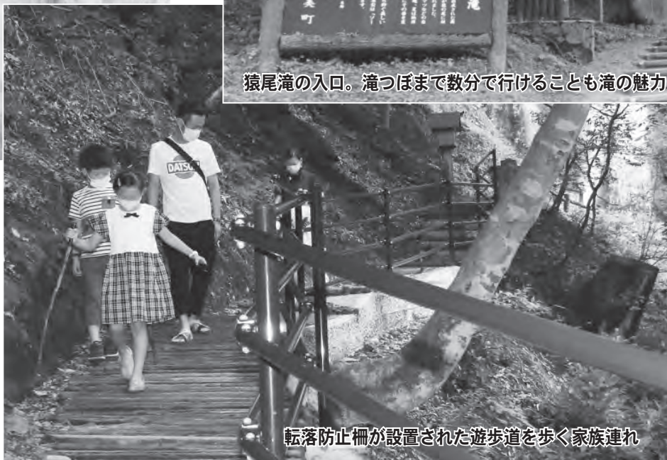
転落防止柵が設置された遊歩道を歩く家族連れ