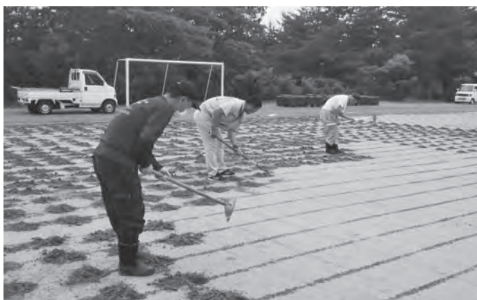
▲この事業を活用してグラウンドを緑化する相岡区の皆さん