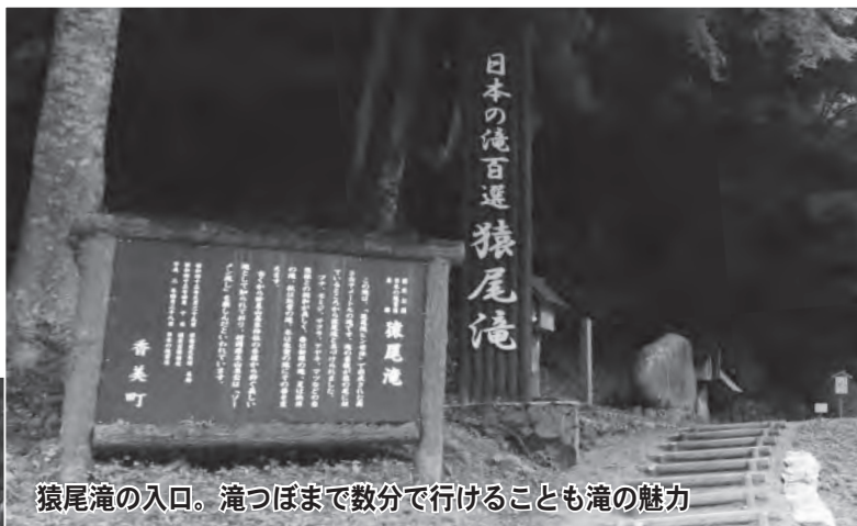
猿尾滝の入口。滝つぼまで数分で行けることも滝の魅力