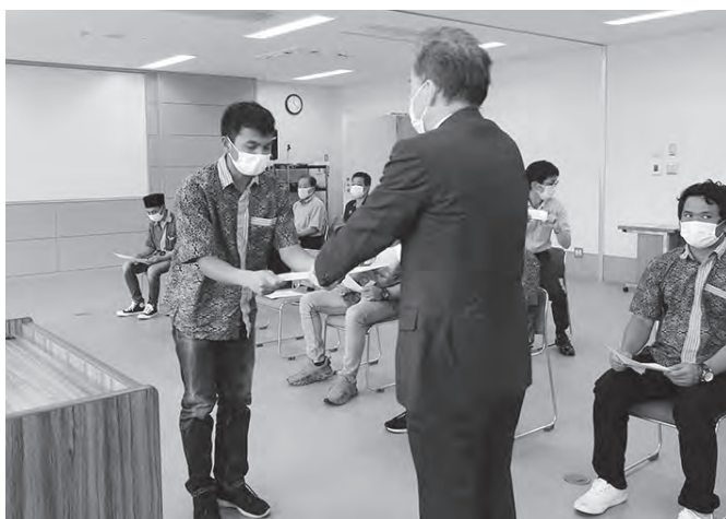
▲浜上町長から修了証書を受け取る実習生

実習生の受け入れは平成27年から始まり、修了生は今回の3期生を合わせて20人になりました。