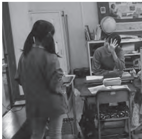
▲複式学級では、児童同士が勉強を教え合うなど、主体的で対話的な学習を進めることができます。

少子化の進行により複式学級が増加し、「複式学級」そのものがマイナスに捉えられがちですが、児童1人に対してきめ細やかな指導が可能となることでより理解を深めるための指導ができることや、2つの学年と一緒に学校生活を送ると、上の学年は下の学年の面倒を見ようとするため「責任感」が育ち、下の学年は上の学年の姿から学ぼうとするため「向上心」が育つなど、多くのメリットもあります。