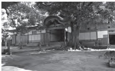
▲大乗寺の客殿および庫裏。ここから文化財を搬出する訓練などが行われています。

町内にも多くの文化財があります。香住区の大乗寺では例年、美方広域消防本部と協力して、放水訓練や文化財の搬出訓練などを行っています。皆さんもこの文化財防火デーを契機に、各地区で現存する文化財の確認を行うなど、保存にご協力ください。