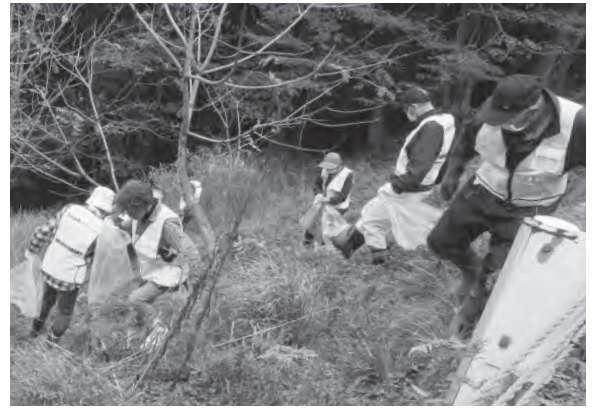
▲不法投棄された廃棄物を回収するパトロールの参加者