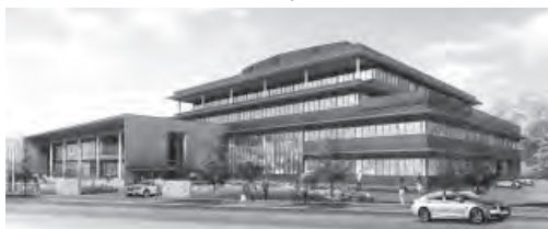
▲同大学のキャンパスのイメージ

各界で世界的に活躍する教員陣が行う講座や、実務経験が豊富な教員からの専門的なアドバイス、大学の専門分野である「芸術文化」「観光」「経営」に関する高校生への出前授業など、地域の企業や住民の皆さんと連携し、一緒にこれからの但馬地域を元気にする事業を開学前から計画しています。 また、地域との連携事業を積極的に実施するために、大学内に「地域リサーチ&イノベーションセンター」を設置します。