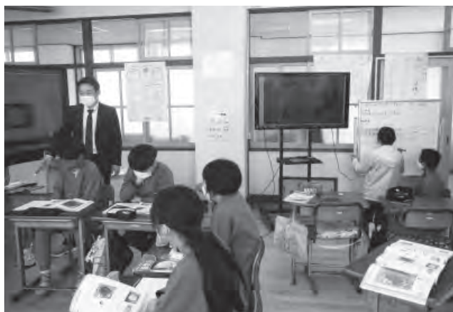
▲余部小5・6年で行われる複式学級の様子。一方では担任が授業を行い、もう一方では生徒が説明を行っています。

このように、複式学級では、児童同士が協力し相互に学び合う姿を見ることが出来ます。これは、本年度から小学校で全面実施となった「新学習指導要領」の大きなねらいである「主体的・対話的で深い学び」を具現化しているものといえます。