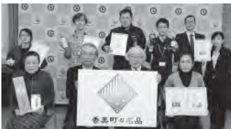
▲認定書授与式に出席した事業者の皆さん

認定された名品について詳しくは町HPおよび町商工会HP（ https://t.goep.jp/ （ https://t.goep.jp/kami-shoukokuai ））に掲載しています。また、過去の名品についても掲載していますのでぜひご覧ください。