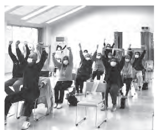
▲体操教室の様子。セラバンドと呼 ばれるゴム製のひもを使い、唱歌 に合わせて30分程度の体操を行っ ています。