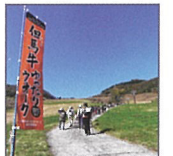
타지마 규 느긋하게 걷기