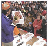
카스미 게 축제