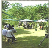
치유의 숲 가든 쇼