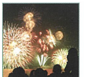
카스미 고향 축제