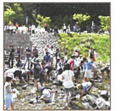
오지로 개국 축제