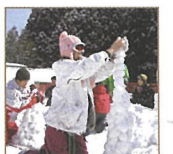
하치키타 스키 페스티벌