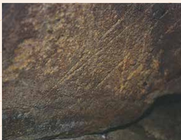
▲ 古墳内部に描かれた壁画。

村岡区高井には古墳や遺跡が七か所見つかっています。そのうち、古墳は4ヶ所あり三之谷一号古墳、二号古墳、高井古墳、鶯が丘古墳で、遺跡は殿岡遺跡、家の上遺跡、蛇雨遺跡の3ヶ所です。その中で三之谷一号古墳を紹介したいと思います。国道9号線沿いに看板が出ている古墳ですが昭和48年に県史跡文化財に指定され、横穴式の円型をしています。この古墳がなぜ指定を受けたかといいますと、古墳の