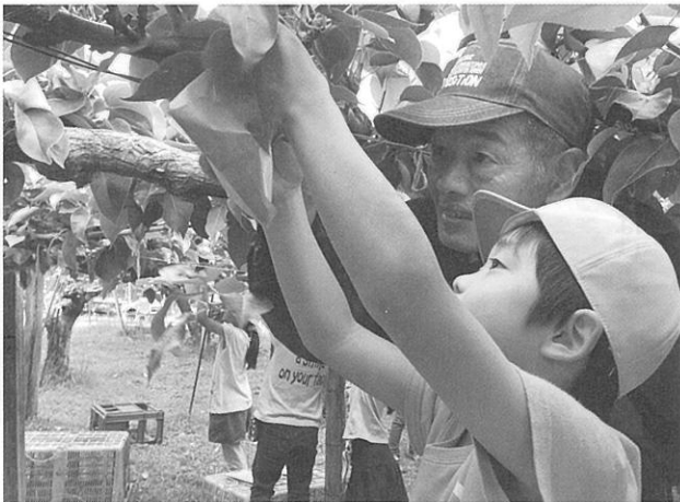
▲生産者と一緒に梨を収穫する児童

本町は、山、川、海の豊かな自然や豊富な食材など、たくさんの学習資源に恵まれています。また学習環境の面では、教職員一人が関わる児童・生徒数が少なく、個別指導がしやすい環境にあり、一人一人を磨き育てる教育が可能です。各学校はこれら地域の特色を生かした魅力ある学校園づくりをそれぞれの校区の実情に応じて行っています。