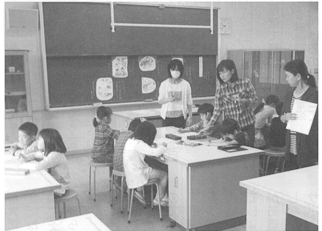
▲チャレンジプランでのグループ学習の様子

教育については将来にわたり常に点検していくことが必要です。各学校は説明責任を果たすとともに、保護者や地域の皆さんに校区の教育について理解していただけるよう、「学校版教育環境会議」を開催しています。