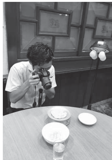
▲香住ガニフェスタの料理を撮影しています