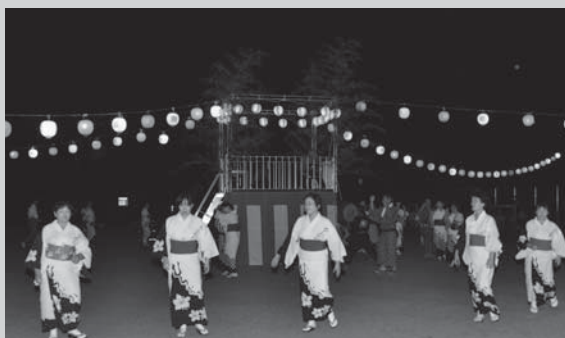
▲新調されたやぐらを囲み盆踊りをする射添地区の皆さん