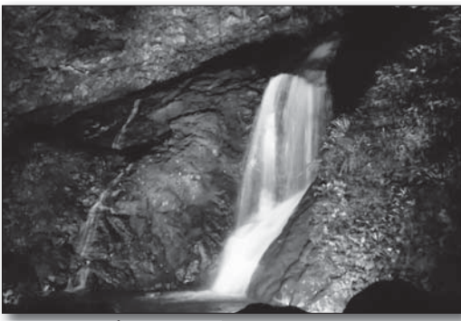
▲ライトアップされた要の滝

参加者の皆さんは「迫力があって素晴らしい」「昼間と雰囲気が変わっていて感動した」と語ってくれました。