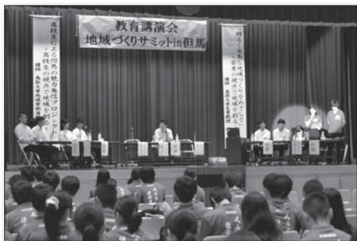
▲活動発表をする生徒の皆さん

高校生の視点で地域の魅力を発信しようと地域づくりサミットin但馬」が開催されました。村岡・生野・出石・浜坂高校の生徒たちが「高校生による但馬の魅力発信プロジェクト」をテーマに、学校で取り組んでいる活動を発表。 村岡高校の生徒は小規模集落の調査を通じて「そこに住んでいる人には当たり前でも、外から見た魅力がたくさんあることを感じた。ふるさと教育を通じて地域活性化をしたい」と発表しました。