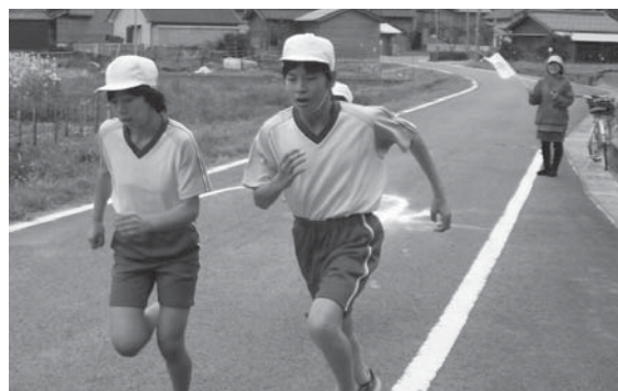
▲昨年度のマラソン大会の様子（佐津小学校）