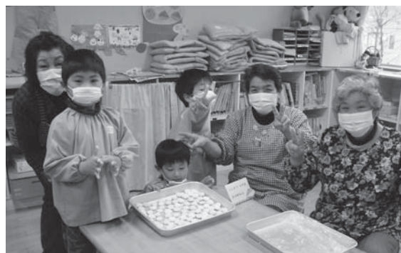
▲昨年度の祖父母参観日の様子（うづか幼稚園）