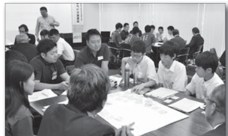
▲高校生議会に向けてワークショップを行う高校生

ユーザーの意見では、景色を含めインスタグラムなどのSNS映えする素材があるので、それらの活用も考えていきます。