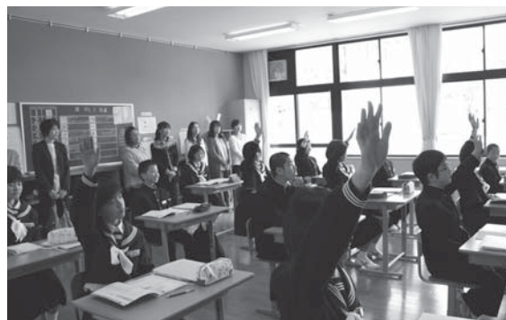
▲昨年度の道徳の授業の様子（小代中学校）