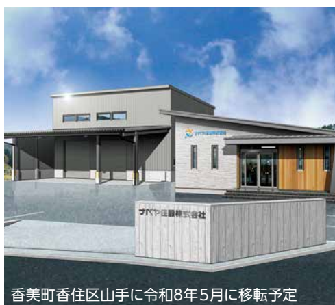
香美町香住区山手に令和8年5月に移転予定

●兵庫県美方郡香美町香住区下浜871 ●TEL.0796-36-3393 ●FAX.0796-36-2823 ●Eメール info@nabeya-jyusetsu.co.jp ●HPアドレス https://www.nabeya-jyusetsu.com/interview