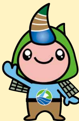
香美町ゆるキャラ「ジオンくん」

区域の大部分が氷ノ山後山那岐山国定公園、但馬山岳県立自然公園に指定されており、但馬牛の生産にも力を入れています。