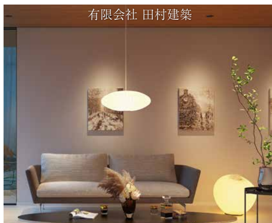
有限会社 田村建築