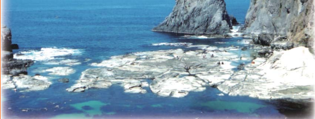
▲海食地形が美しい「今子浦」