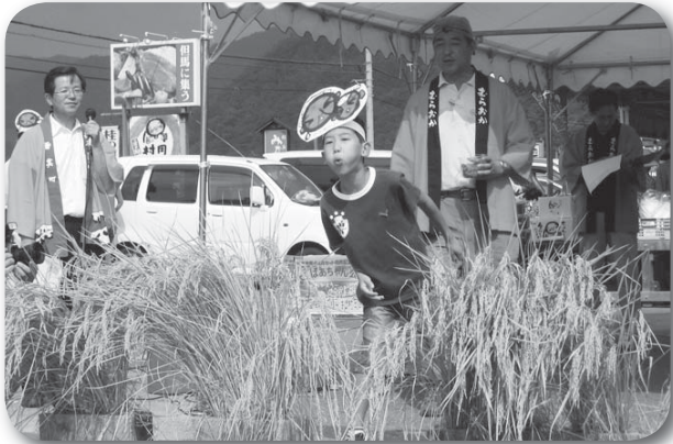
▲梅干しの種を飛ばす参加者「もっと遠くまで飛んでいけ〜！」

「矢田川みそ」、「手作り梅干し」、「但馬牛米」の村岡を代表する特産物を町内外にPRしようと村岡産業クラスター研究会が主催して毎年行われている同イベント。