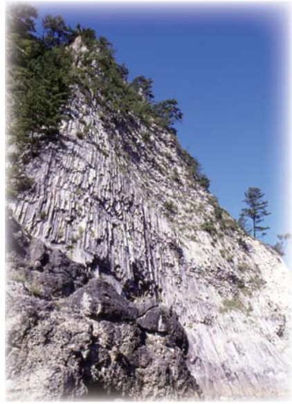
▼柱状節理と板状節理の芸術「鎧の袖」

10月28日、東京で開催された日本ジオパーク委員会で、山陰海岸が世界ジオパークネットワーク(GGN)の国内候補地に決定しました。