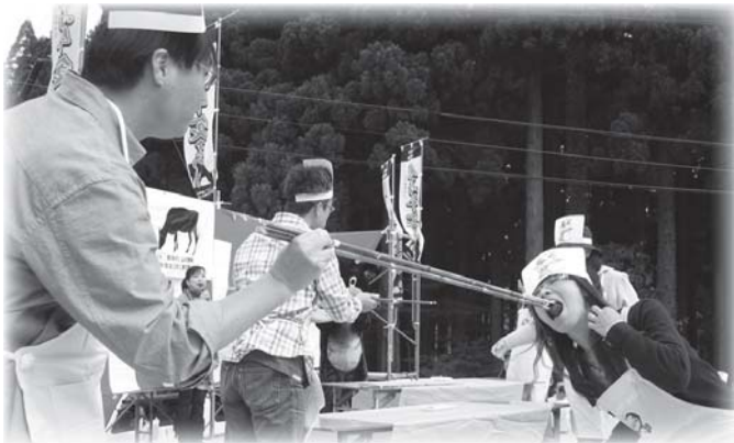
▲長さ約1mのはしを使って、相手にサイコロステーキを食べさせあう「但馬牛もろくと食べ大会」

上質和牛の最高峰「但馬牛」の原産地を広くPRすることも、山のまち村岡区・小代区の豊かな食材をアピールするため、10月25日、香美町山の祭典として「第2回 但馬牛食まつり」が行われました。 八千北スキー場ファミリーゲレンデ駐車場では、但馬牛ホルモン鍋、但馬牛米の牛そばかけ丼などの料理、但馬牛もろくと食べ大会、但馬牛クイズなどが行われ、多くの来場者で賑わっていました。