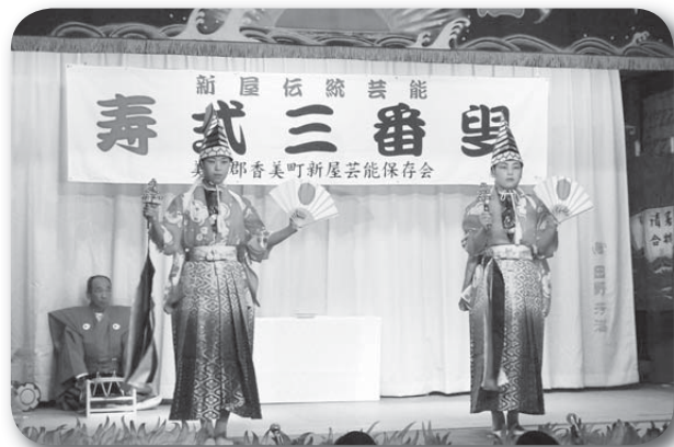
▲新調した衣装で演じられる三番叟

10月25日、地区の秋祭りで奉納された三番叟は、同日夜に行われた新屋秋祭り演芸会でも衣装新調特別公演として演じられました。この演芸会では、三番叟をはじめ、歌や踊り、村芝居などが行われ、来場した観客を楽しませていました。