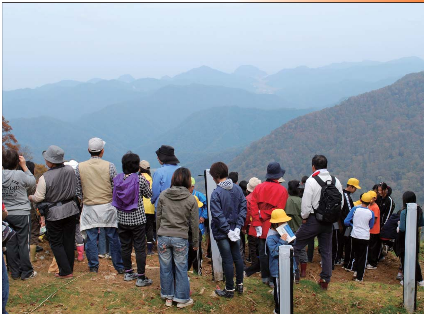
【写真】 眺め最高！空の展望台