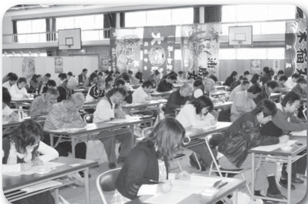
▲試験に取り組む受験者

全国屈指の松葉ガニの水揚げ量を誇り、そして近畿で唯一ベニズワイガニ(香住ガニ)が水揚げされるカニのまち、香美町をPRしようといわれた「香住！カニ検定」。