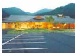
かすみ・矢田川温泉