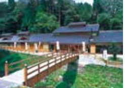
ハチ北温泉 湯治の郷