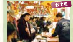
かすみ朝市センター

漁港で水揚げされたばかりの 新鮮な海の幸をどうぞ。 ●時間 / 8:30~15:00 (11月6日~3月20日の日祝は16:00まで) ●定休 / 年中無休 map 7 ☎0796-36-4500