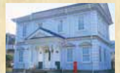
村岡民俗資料館まほろば

縄文時代早期の石器や土器 などの資料を展示しています。 ●時間 / 13:00~17:00 土曜、日曜 9:00~17:00 ●定休 / 祝日、月曜 map 28 ☎0796-98-1154