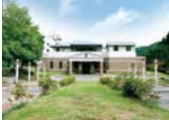
ふれあい温泉 おじろん