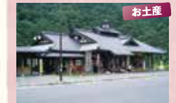
道の駅 あゆの里矢田川

季節により、アユや川カニの 定食が食べられます。 ●時間 / 9:00~18:00(冬期17:00まで) ●定休 / 火曜 map 13 ☎0796-95-1369