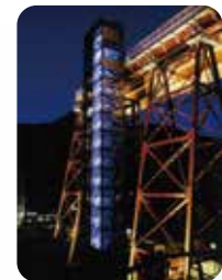
美しい、夜のライトアップ。

余部鉄橋の巨大な橋脚の上にある展望施設。高さ41mの「空の駅」までは全面ガラス張りのエレベーター「余部クリスタルタワー」で上がるので、眺めは壮観。 map 2