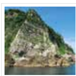
天然記念物 鐘の袖