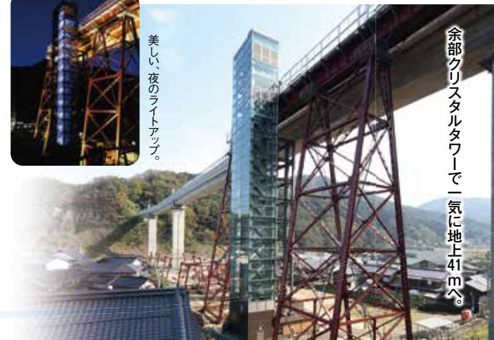
余部クリスタルタワーで一気に地上41mへ。