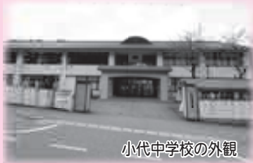
小代中学校の外観