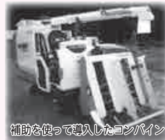
補助を使って導入したコンバイン

持続的な農地保全を図るため、認定農業者などの中核農業者が導入する農業機械器具の購入経費に対して補助を行いました。