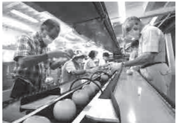
▲梨に傷がないかチェックする生産農家ら