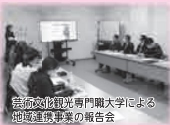
芸術文化観光専門職大学による地域連携事業の報告会

県立芸術文化観光専門職大学と連携し、持続可能な地域づくりを目指す地域連携業務や県立高校のコミュニケーション教育業務を実施しました。