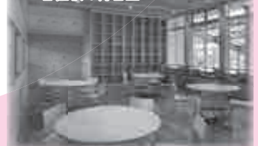
快適に過ごせる空間に整備されたJR香住駅の待合室

新型コロナウイルス感染症の影響を受け落ち込んだ観光産業回復のため、まちの玄関口である香住駅待合室の環境を明るく快適な状態にするための改修工事などを行いました。