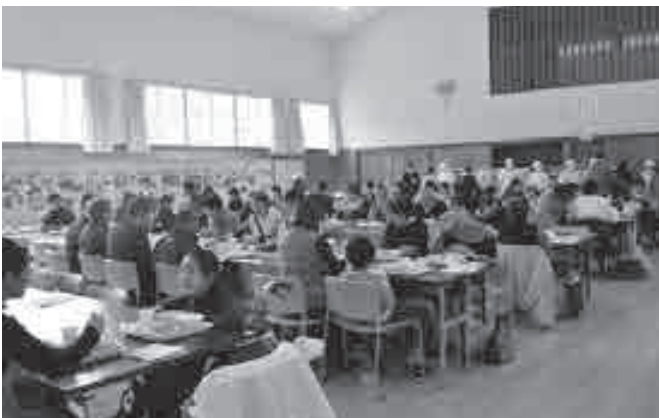
▲前回のふるさと給食試食会の様子