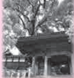
施設整備を行った大乗寺