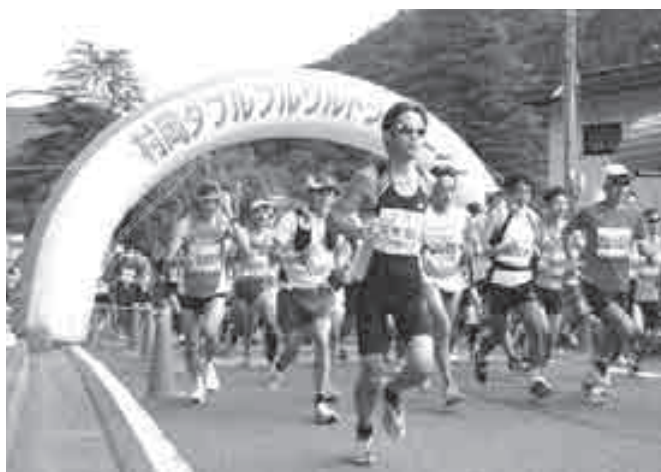
▲勢いよくスタートゲートをくぐっていくランナー

大阪府から参加した男性は「毎年参加しています。アップダウンが本当に大変ですが、自然がきれいだし走りがいがあります」と気合を入れていました。