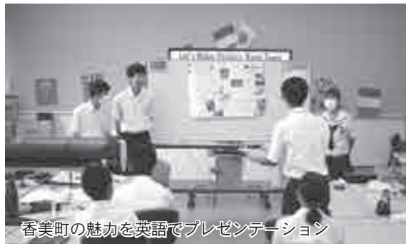
香美町の魅力を英語でプレゼンテーション