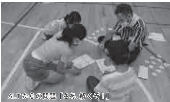
ALTからの問題「さあ、解くぞ！」

7月22日の香住会場には香住区内5小学校の13人、7月25日の村岡会場には村岡・小代区内3小学校の13人の6年生が、町教育委員会とALTが企画・進行するレクリエーションやゲーム、ショッピングなど英語を使ったさまざまな体験活動にチャレンジしました。活動の1つ、エスケープゲームでは、5人のALTが繰り出す問題をグループで協力して解いていき、英語でコミュニケーションを取りながらゴールを目指しました。