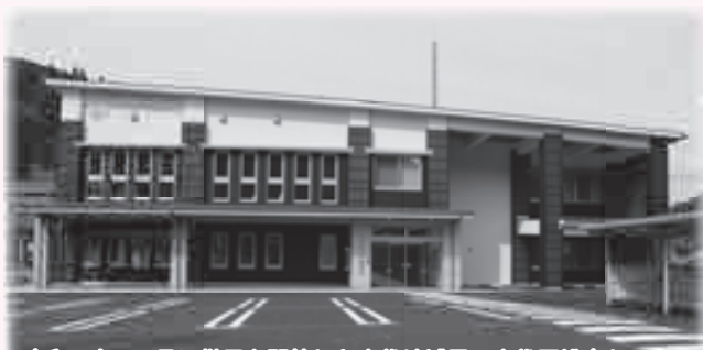
令和3年10月に供用を開始した小代地域局・小代区総合センター