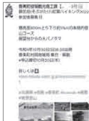
▲ Twitter で情報発信しています！