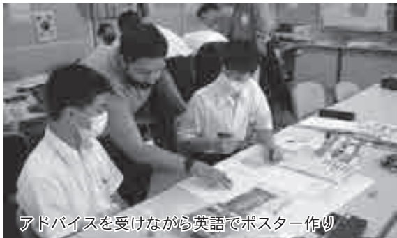
アドバイスを受けながら英語でポスター作り

8月1日・2日、町内3中学校3年生7人、2年生8人が香住第一中学校に集まり、さまざまな国の外国人講師と「ふるさとの魅力」をテーマに実践的な英語を使ってコミュニケーションを取りながら、本町の魅力を発信するポスターを作成しました。活動の最後には、作成したポスターを使ってすべて英語によるプレゼンテーションを行い、2日間に渡って英語での対話スキルを学びました。