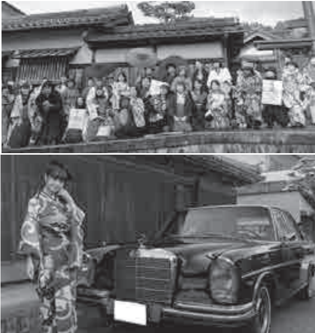
▲過去の開催の様子

智頭町では毎年11月に、趣ある町並みが残るかつての宿場町「智頭宿」を舞台に、色とりどりの着物を着て町並みやワークショップを楽しむ「ちづ宿ハイカラ市」を開催しています。出し物や出店はもちろん、最近は写真映えすることでも人気を集めるイベントです♪