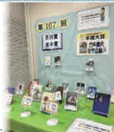
▲香住区中央公民館図書室で第167回芥川賞・直木賞と候補作品の展示、貸し出しを行っています。

いずれも1935年の創設以来、日本文学最高峰の賞として長い歴史があります。読書の秋に、時代を彩る作品を読んでみては、いかがでしょうか。思いがけない作品に出会えるかもしれませんね。