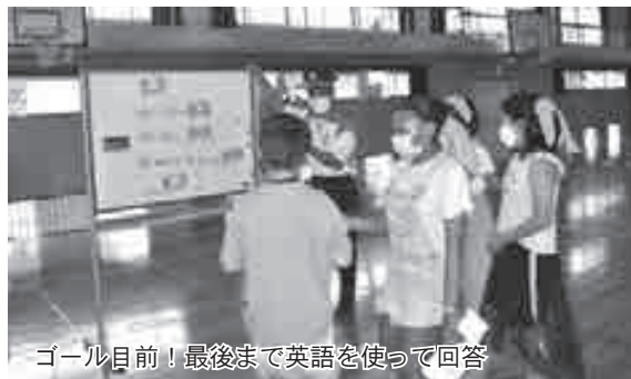
ゴール目前！最後まで英語を使って回答