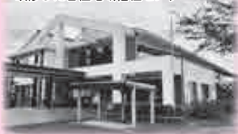
改修した香住地域福祉センター