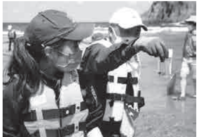
▲ビンに入れた生き物を観察する参加者

参加していた豊岡高校の生物自然科学部の生徒は、光合成をするというウミウシの説明に興味深そうに聞き「海の生き物を観察することはあまりなかったが、多様な生態を持っていて面白い」と話しました。