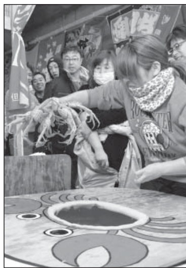
▲水槽からセコガニを引き上げる参加者

香住の水産物の販売促進を目指して行われている「大漁かにまつり」（但馬漁業協同組合主催）が昨年12月7日、同組合の直販店・遊魚館近くの上屋で行われ、多くの観光客が訪れました。