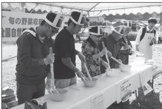
▲自然薯を折らないように微妙な力加減をしながらすりおろす参加者

特産「自然薯」に舌鼓! 自然薯まつり(11月30日、道の駅村岡ファームガーデン)