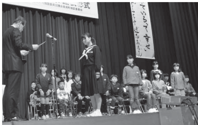
▲表彰状を授与される受賞者の皆さん

全国各地で人権に関するさまざまな催しが行われましたが、本町でも人権の尊さを再認識しようと、昨年11月30日に香住区中央公民館で人権講演会（町、町教育委員会、町人権教育研究協議会が共催）を開催。多くの皆さんが参加し、人権についての学びを深めました。