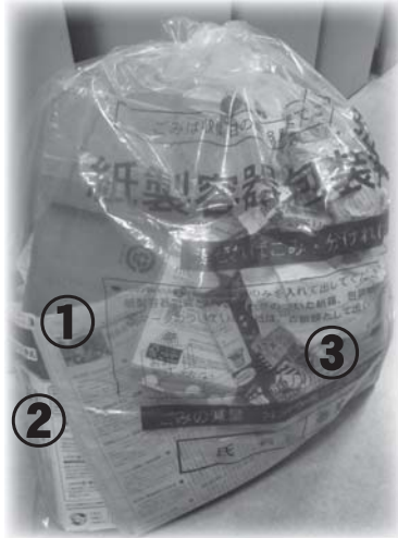
①新聞や雑誌などが混ざっている