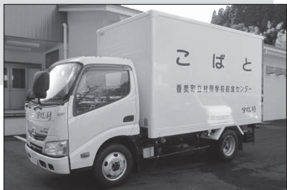
▲更新された給食配送車「こぼと」

新しくなった配送車「こぼと」は、ふるさとの食材にこだわり、調理員の皆さんがまごころ込めて作った安全・安心な給食を、今日も笑顔で待つ子どもたちに届けています。