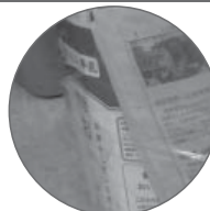
②牛乳パックが混ざっている

⇒牛乳パックなどの紙パックは水ですすぎ、切り開いた後、ひもで束ねて「古紙類」で出してください。