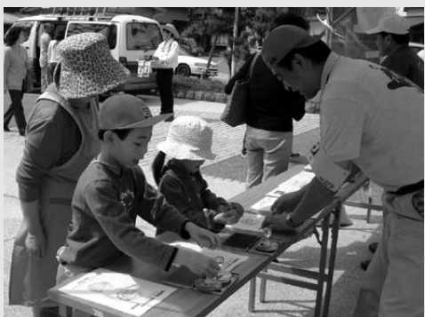
▲5月6日 期間中、約3,500人が余部鉄橋記念スタンプを楽しむ。

この間、余部小学校4年生が描いたヘッドマークを付けた臨時特別快速列車「あまるペロマン号」が運行され、2,845人の乗客が鉄橋の上から、ひとときの空中散歩を楽しみました。4日には、余部小学校4年生のみなさんも記念に乗車し、車内のアナウンスで「この列車は余部小学校4年生6人に作成していただいたヘッドマークを装着しています」と紹介されると、「有名人になった」と照れくさそうにっていました。