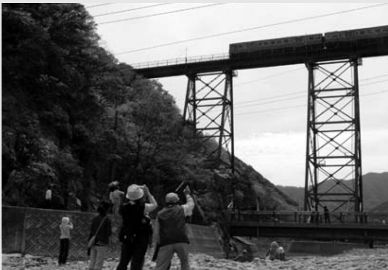
▲5月4日 シャッターチャンス到来。列車の音とともに一斉に上を向く行楽客。余部に来たからには、これだけは見て帰らねば...

ゴールデンウィークの5月3日から7日にかけて、余部鉄橋メモリアル事業が開催され、全国から多くの行楽客が詰めかけた。今のままの姿で鉄橋が見られるのも今年が最後ということもあり、昨年に比べ来訪者数も大幅に増加しました。改めて鉄橋の魅力のすごさに驚嘆しました。