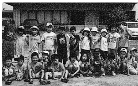
▲みんなでにぎやかに（平成17年度）

放課後児童クラブ香住遊ぶるでは、期間中、子どもたちのお世話をさせていただく臨時職員を募集します。 詳細は、15ページのけいじばんをご覧ください。