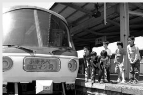
▲5月4日 あまるペロマン号に余部小学校4年生が乗車

キング」では、参加者52人が日本海からの潮風薫る中、爽やかな汗を浮かべていました。養父市から参加された一ノ本さんご夫婦は、「車で来たことにはあるけど、灯台まで歩くのは初めて。特に御崎集落から灯台までの遊歩道は、海が見えてすばらしい景色でした」と感想を述べられました。ゴールの余部埼灯台では、灯台まつりが開催される中、藤原町長とがすみ香りレディがウォーキング参加者らを出迎え、労をねぎらいました。