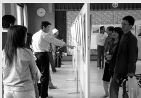
▲5月5日 ゴールデンウィーク中、余部鉄橋写真展に約1,750人来場