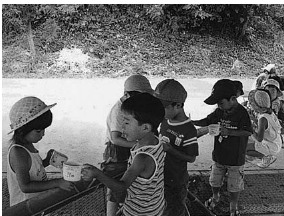
▲流しそうめんを楽しみました（平成17年度）

夏休み期間中、仕事などで昼間家庭に保護者のいない幼稚園児と小学校1年生から4年生までの児童を対象とした放課後児童クラブ香住遊ぶる（通称・遊ぶるクラブ）を開設します。