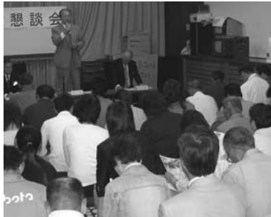
▲長井地区公民館にて

問：最近、幼児・小学校低学年の事故、事件がテレビ等でよく報道されている。昨年香住区でも13件の不審者の目撃情報があつたが、町として何か対策を考えているのか。 答：学校単位でみまもり隊の編成などを行い各区で対応している。また、香住区ではここ数年でどこでどのような事件、事故が起きたかといった情報をもとに安全マップを作成している。また、警察からは、常に最新の情報をいただけるようにし、その情報はすべてに各小中学校に連絡している。(教育長)