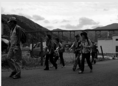
▲5月6日 余部埼灯台絶景ウォーキング