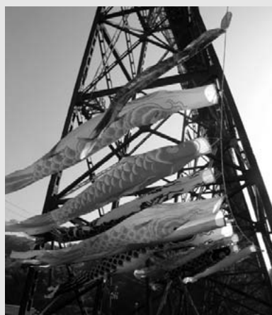
▲5月3日 元気に泳ぎ鉄橋イベント