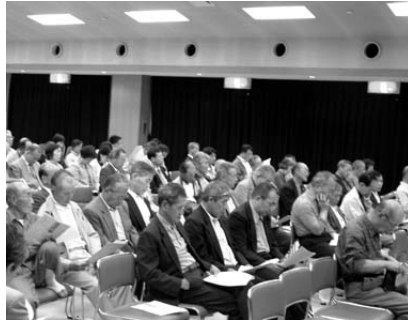
▲村岡老人福祉センターにて