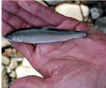
▲5月28日 矢田川漁協による試し釣りでも10~15センチのアユが釣れていた