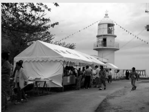
▲5月6日 余部埼灯台まつり開催