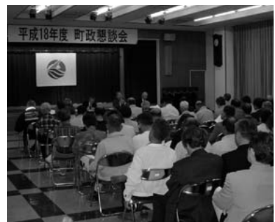
▲小代区総合センターにて