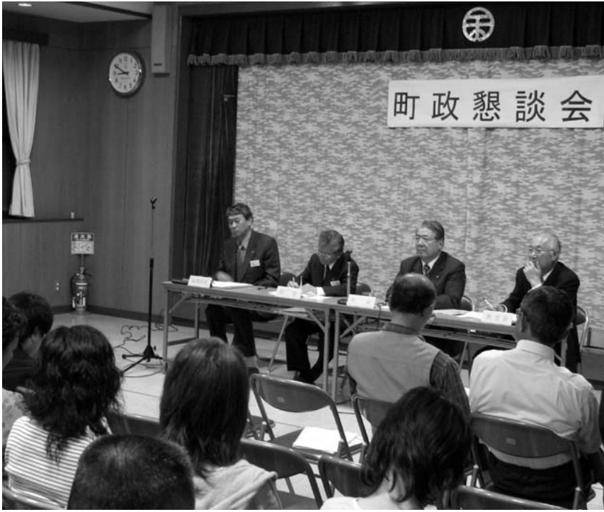
活発な意見が交わされた町政懇談会（5月26日、余部地区公民館）

懇談会では、町長が香美町の町政推進の方針と各区の主要な政策・課題などを説明したあと、参加者と意見交換を行いました。ここに意見の概要を紹介いたします。なお、紙面の都合上、全てのご意見を掲載しておりませんがご了承ください。