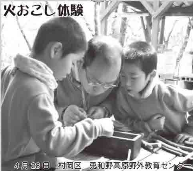
4月28日 村岡区 兔和野高原野外教育センター