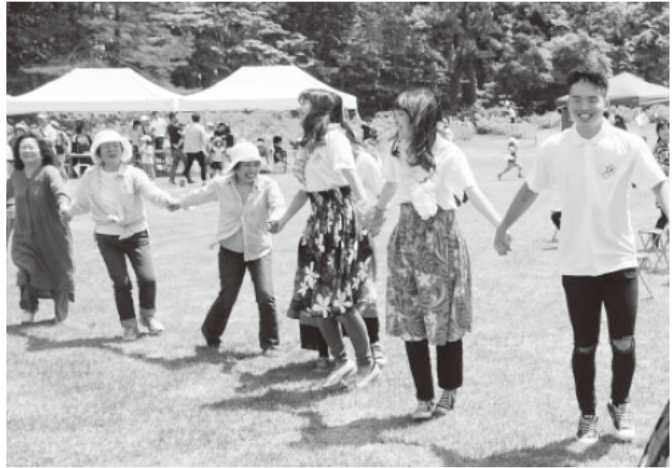
▲美しい自然の中で歌や踊りを楽しみました