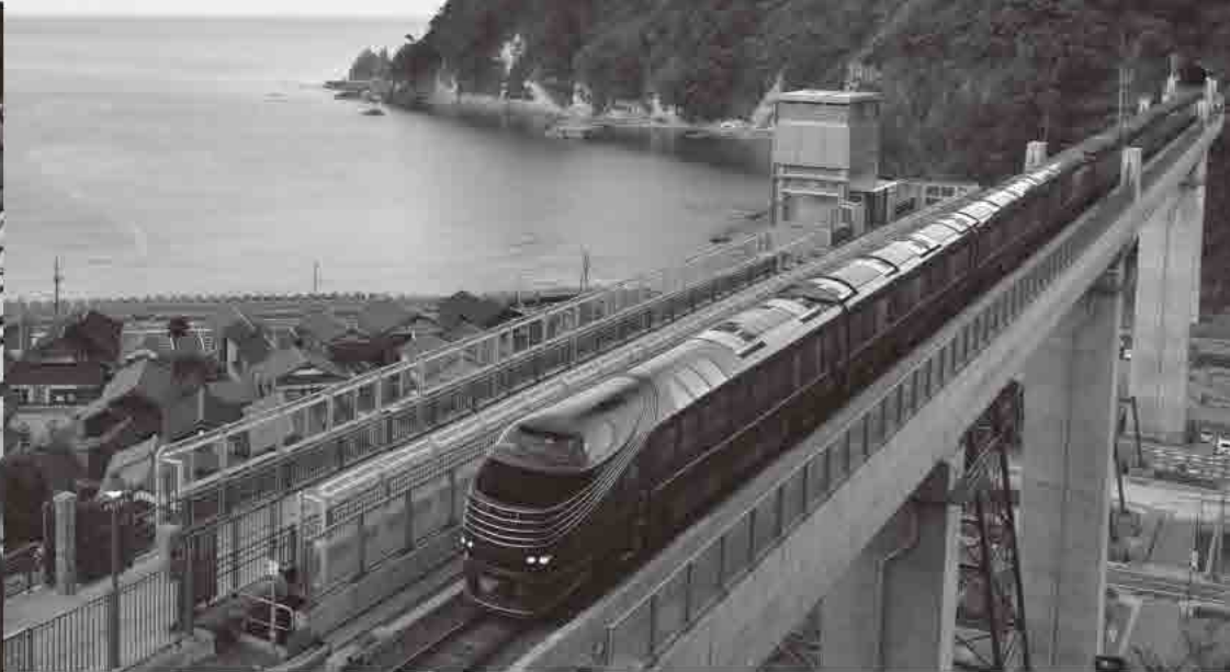
▲余部橋りょうを通過する寝台列車端風