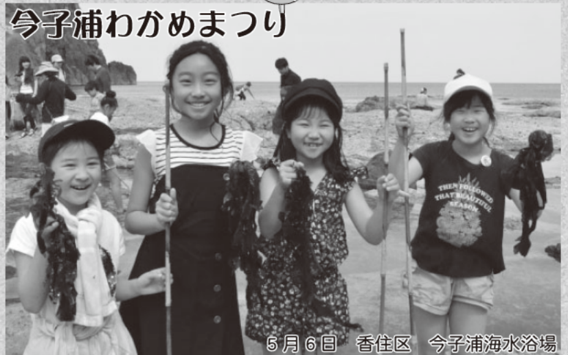
5月6日 香住区 今子浦海水浴場