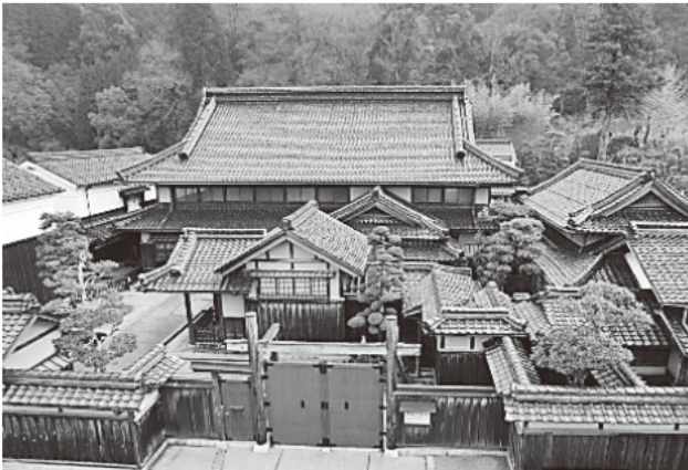
▲杉林を背にたたずむ豪邸「石谷家住宅」(智頭町)