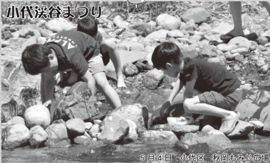
5月4日 小代区 秋岡もみじ広場