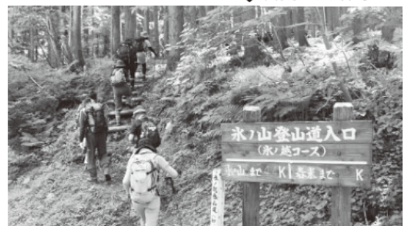
▲山頂に向けて出発!