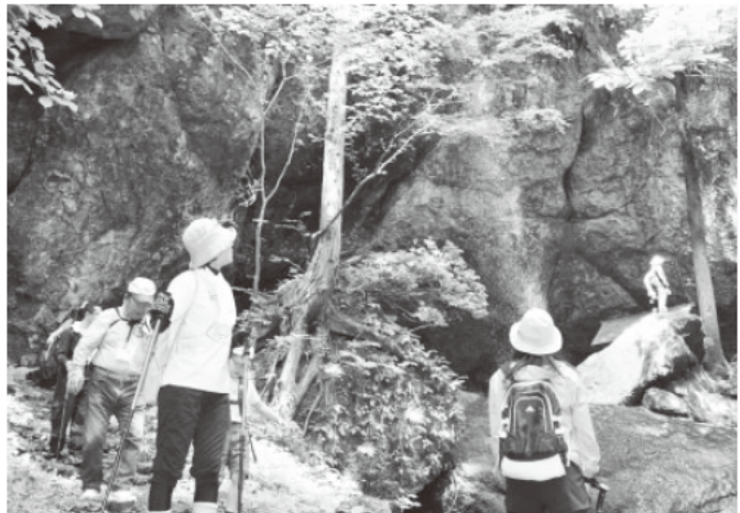
▲県指定文化財記念物名勝「吉滝」のポイントを通過する参加者

ゴール後は、但馬牛のサーロインを使用したローストビーフと、チョウザメの魚醤を使用したアイスが配布され、小代の味覚に舌鼓を打ちました。