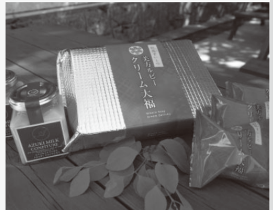
▲こだわりの詰まった、あかりファクトリーの商品

A. 現在、小豆の収穫量は農家が高齢化していることに加えて、獣害や天候に左右され、足りない状態です。農家が潤い、モチベーションが上がる農業体制が構築できればいいと感じています。「一人勝ち」ではなく、「農家と共に」事業展開ができるよう取り組み、それをやりがいと感じられる人生を送っていきたいです。