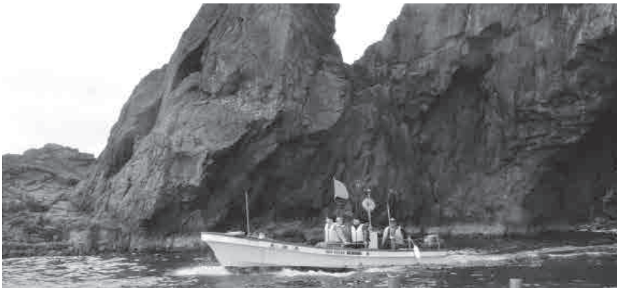
▲奇岩や洞門などを巡る「かすみ海上GEO TAXI」

さらに、平成30年度に策定した香美町観光振興計画の実践委員会（仮称）を設置し、計画の実践を行います。このほか、「麒麟のまち観光局」による広域観光連携を進めるとともに、外国語版ホームページの管理や多言語翻訳機の購入補助を行い、観光客の滞在時間の拡大やインバウンド対策を図ります。