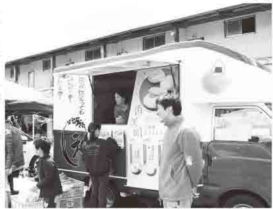
▲移動販売車でモナカアイスを提供する地域おこし協力隊員

私の実家は三木市にあり、山田錦の生産農家です。農業の担い手不足は、深刻な問題です。本町も同じ状況であ