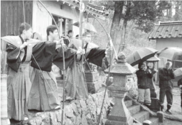
▲崖上の御崎集落で行われる「百手の儀式」(香美町)

麒麟のまち圏域で31の文化財群がストーリーを構成し、本町では、鎧の麒麟獅子舞、百手の儀式、余部鉄橋、香住海岸、岩石海岸の漁村集落、氷ノ山後山那岐山国定公園が含まれています。