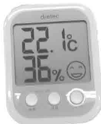
▲全学校園にデジタル温湿度計を配置し管理を徹底