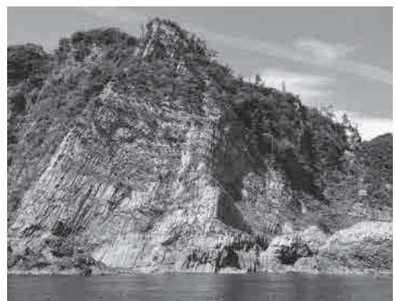
▲ジオスポット「鐵の袖」

山陰海岸ジオパークについては、鳥取県東部から京都府北部までの同ジオパーク推進協議会との連携を引き続き図るとともに、2度の世界再認定を受け、パンフレット作成やジオカヤック指導者講習会・検定会、ジオパークウォーキング、ガイド養成など、ジオパーク活動の普及・推進に努めます。