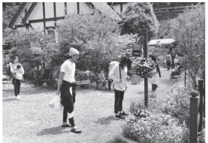
▲開放された庭を鑑賞する来訪者

また、地区内の民宿ではランチセットや手作りパンケーキなどが提供されたほか、花苗の販売なども行われ、訪れた人々はおもてなしを満喫していました。