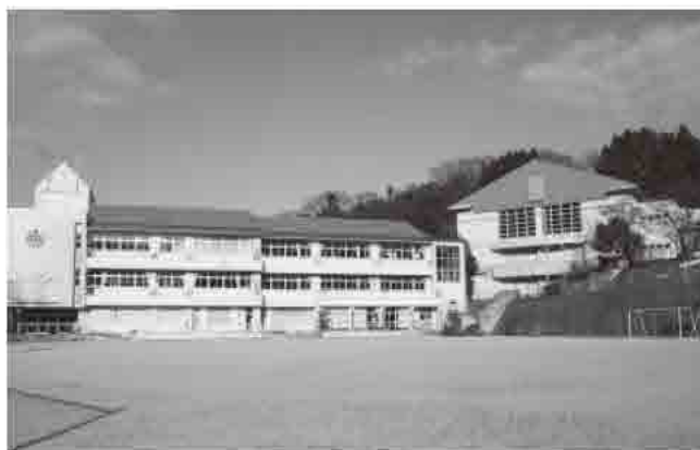
▲大規模改修を行う柴山小学校の校舎