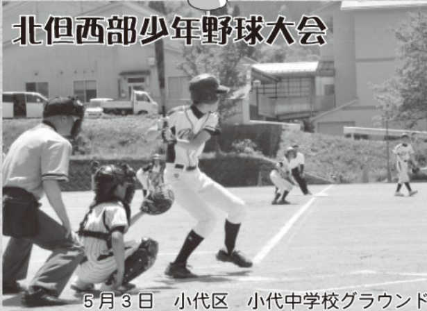
5月3日 小代区 小代中学校グラウンド