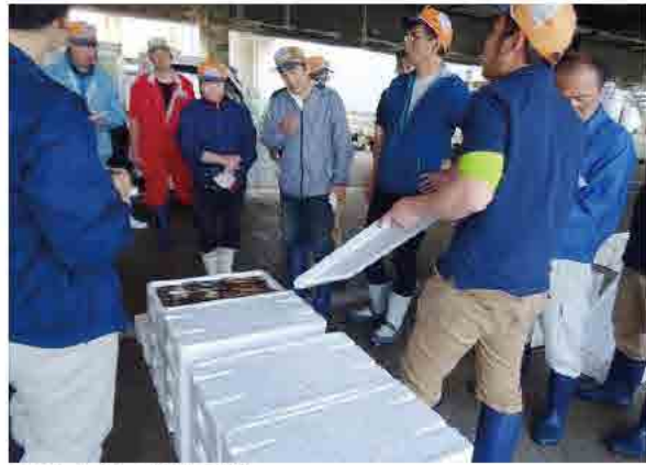
▲スルメイカの競りの様子

香住で水揚げされるスルメイカの品質は、ほかの地域の追隨を許さないほど素晴らしく、当時は、どこの産地にも負けないように必死で競りをしていました。