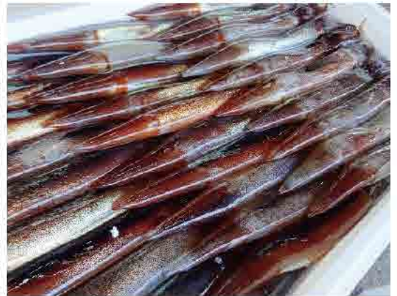
▲新鮮なスルメイカが水揚げされています

香住のスルメイカ漁は、春から夏にかけて、夜間集魚灯を照らし、イカ釣り機で引き上げる「沿岸一本釣り」が主流です。9月初めから5月末まで行われる底曳網漁でも取れるので、ほぼ年中、水揚げされています。香住産スルメイカの素晴らしさの秘訣は、鮮度と選別にあります。漁業者は鮮度を保つために、釣り上げたスルメイカをできるだけ早く発泡に詰めるように努力しています。また、選別の正確さは目の肥えた仲買人をうならせています。