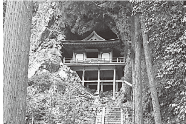
▲岩窟にたたずむ古堂「不動院岩屋堂」(若桜町)