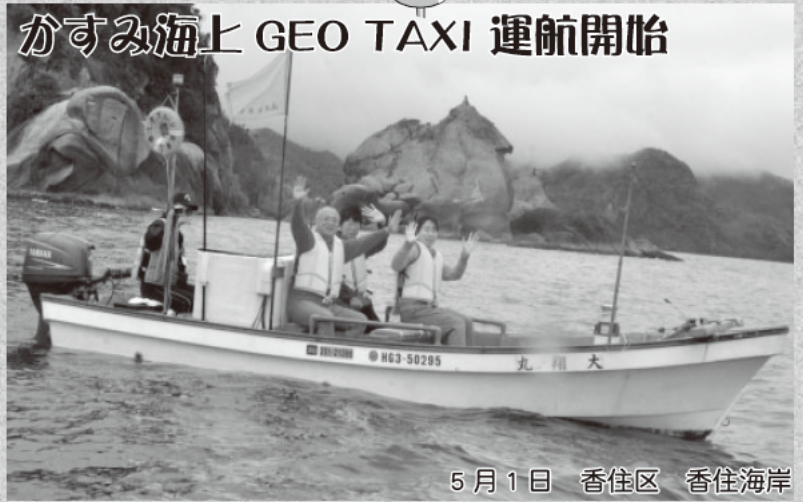
5月1日 香住区 香住海岸