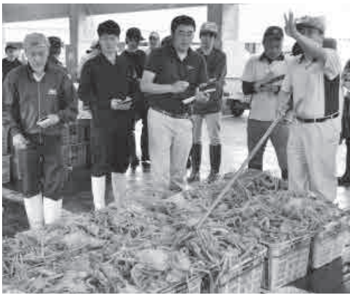
▲ベニズワイガニの競りの様子

松葉ガニの資源量は近年減少傾向にあり、水産庁が行う資源調査により海域別に漁獲可能量が設定されていますが、漁獲制限は水産業者や観光関係業者などにも大きな影響を及ぼすため、今後も関係機関と緊密に連携を図ります。