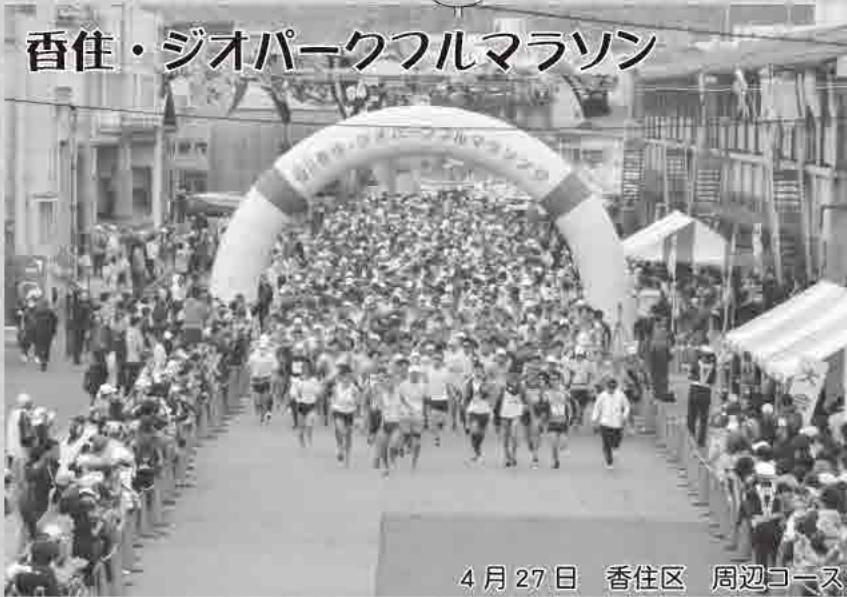
4月27日 香住区 周辺コース