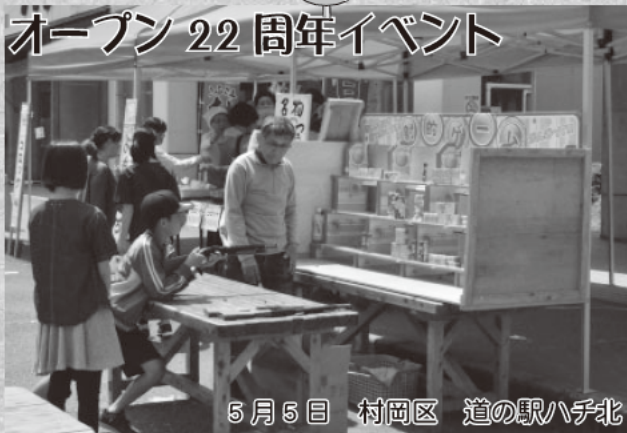
5月5日 村岡区 道の駅ハチ北