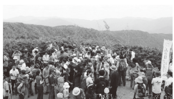
▲登山者でにぎわう山道