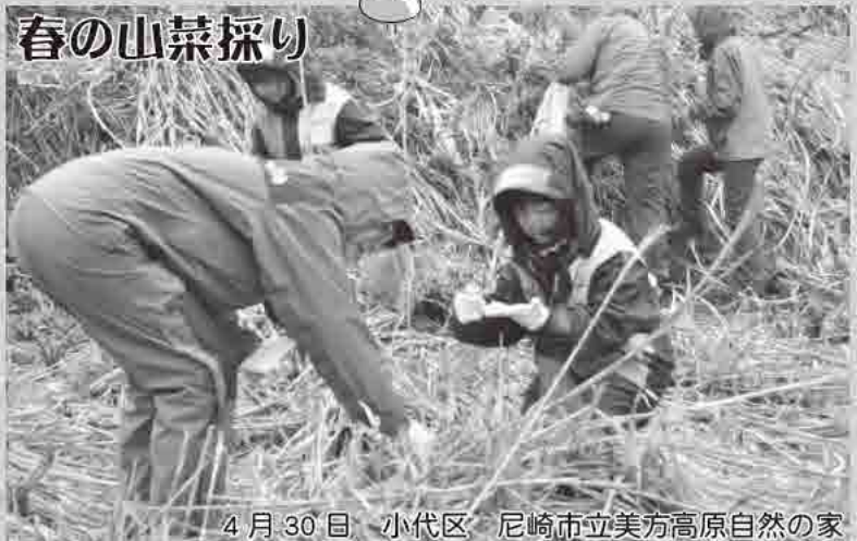
4月30日 小代区 尼崎市立美方高原自然の家