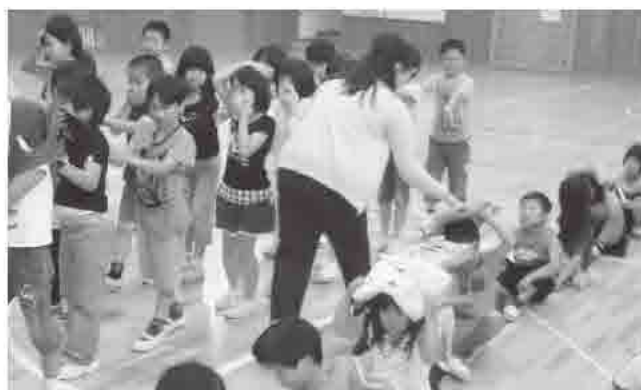
▲学校で行われている避難訓練の様子

防災教育副読本や学校防災マニュアルを活用した防災教育を推進するとともに、関係機関の協力を得て防災体制の充実を図っています。また、通学路の点検・整備や見守り隊との連携により子どもたちの登下校の安全対策に取り組んでいます。