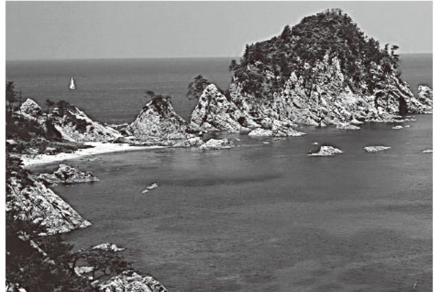
▲荒波によって削り出された「浦富海岸」(若桜町)