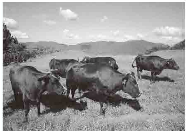
▲日本農業遺産に認定された美方郡産但馬牛

林業振興については、町域の約86%を占める森林資源の有効活用と多様な公益的機能を保全するため、急傾斜地の防災機能の向上を図る森林整備、針葉樹林と広葉樹林の混交林および里山林の整備などを行う「災害に強い森づくり推進事業」、国県町が連携した造林補助事業である「森林管理100%作戦推進事業」に継続して取り組みます。また、新たな地域おこし協力隊による「木の駅プロジェクト推進事業」の充実を図ります。