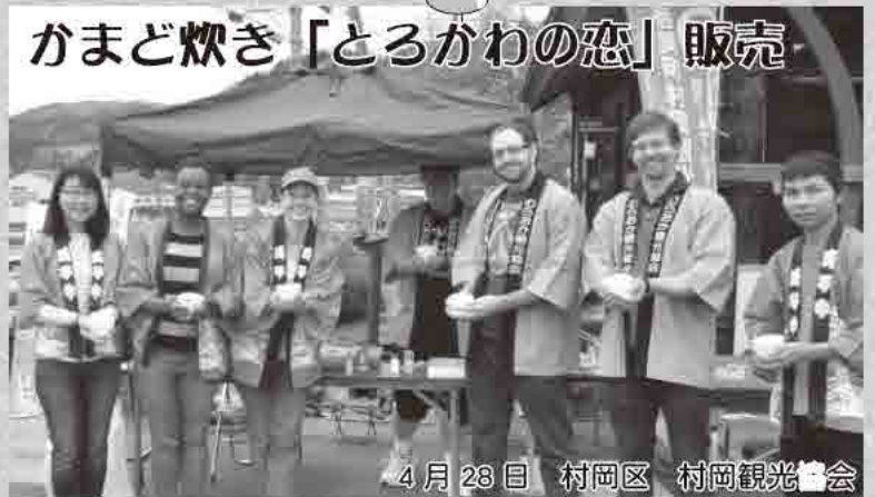
4月28日 村岡区 村岡観光協会