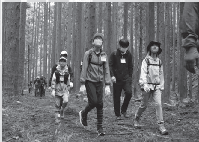
▲新緑の景色を楽しみながら歩く参加者たち（大谷コース）

参加者からは「完歩できてよかった」「出来たてのみそ汁やぜんざいがとてもおいしかった」「来年も楽しみ」などの声がありました。