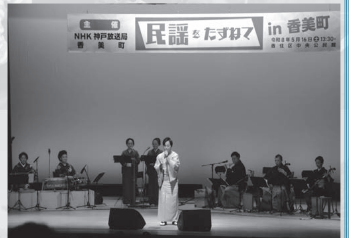
▲公開収録で民謡を披露する出演者

この日収録した番組は、6月23日(火)、30日(火)、7月7日(火)の3回放送予定ですので、皆さんぜひお聞きください(放送時間はいずれも11時25分～11時50分です)。