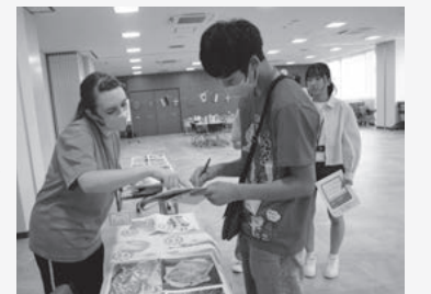
▲ミニ万博でお土産購入体験

中学2、3年生を対象としたESCでは、香住文化会館で、大阪万博にちなんで「ミニ万博に行こう」をテーマに、外国人講師が店員となった各国のパビリオンを訪問。それぞれの国の文化や自然を学びながら、お土産の購入体験を通して、英語を使ったコミュニケーションに挑戦しました。