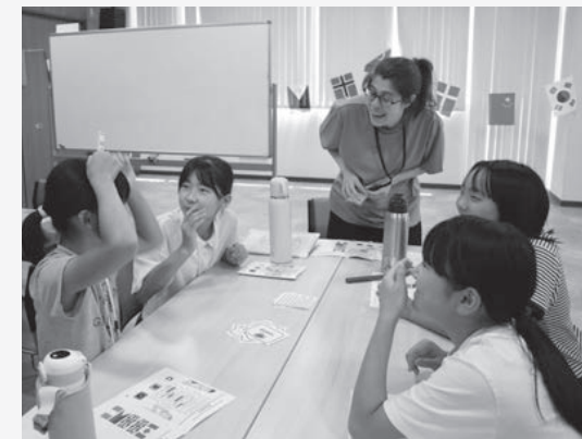
▲英語で楽しくクイズに回答

小学6年生を対象としたESAでは、外国人講師が企画・進行するレクリエーションやゲームなど、英語を使ったさまざまな体験活動にチャレンジできます。英語版「だるまさんが転んだ」や、目隠しした仲間を英語で誘導するゲームなど、体を動かしながら自然に楽しく英語に親しめるイベントを行いました。