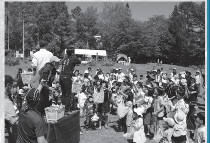
▲毎年恒例「お菓子まき」

子どもと一緒に初めて訪れたという豊岡市の女性は「心地よい場所だった。子どもがとても喜んでいたので来てよかった」と満足そうな様子でした。