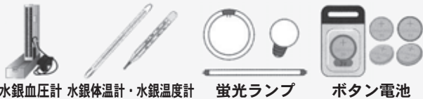
水銀血圧計 水銀体温計・水銀温度計 蛍光ランプ ボタン電池