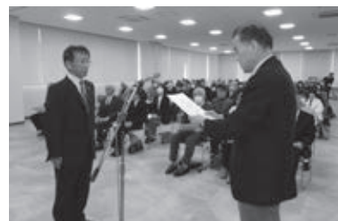
▲昨年 12 月 11 日、浜上町長から委嘱状が伝達されました

皆さんの身近な相談相手として、また行政とのパイプ役となって地域福祉、児童福祉を担います。