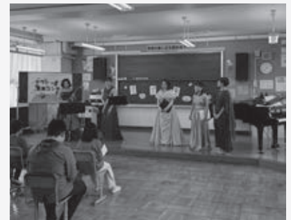
▲余部小学校でのコンサート

演奏会では、最初にサプライズとして、音の窓の皆さんがアレンジした各小学校の校歌を演奏していただき、児童の皆さんが「あつ、知ってる」と顔を輝かせながら歌っていたことが印象的でした。