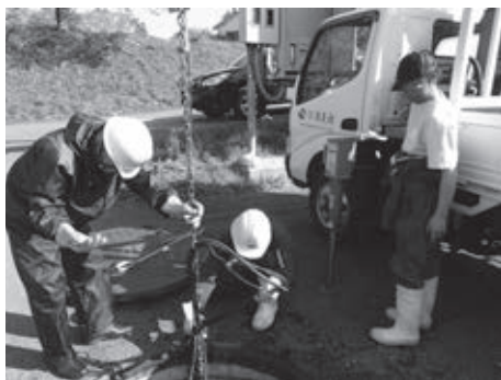
▲ポンプ引き上げ作業

下水道ポンプが緊急停止すると、汚水がマンホールから溢れることがあります。緊急停止するたびに作業員が出動し、ポンプ本体を引き上げ、異物の除去をしています。