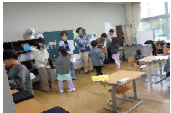
2年生 インタビュー