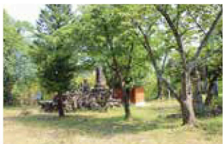
小高い山の頂上は平らに明るく開けており、ひと休みできる。