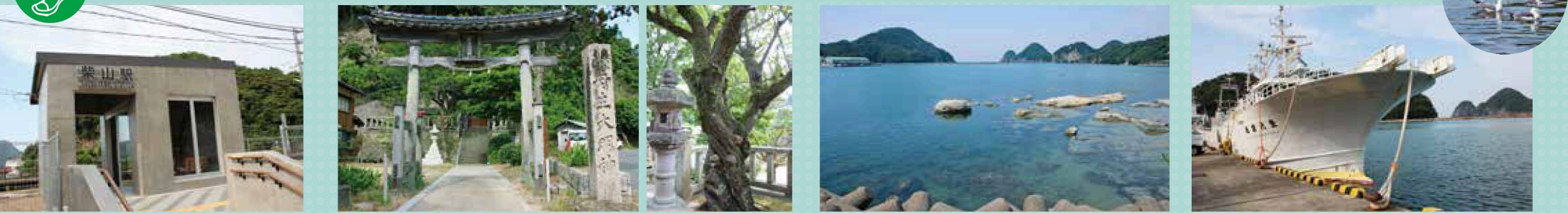
JR 柴山駅：モダンなボックス型の無人駅 → 丹生(にゅう)神社：道沿いにあり、気軽に立ち寄れる。立派な鳥居と整備された境内 → 柴山湾・柴山港：リアス式海岸特有の深い入江が天然の良港。透明度の高い水面に大型の漁船が並び、カモメが遊ぶ。←