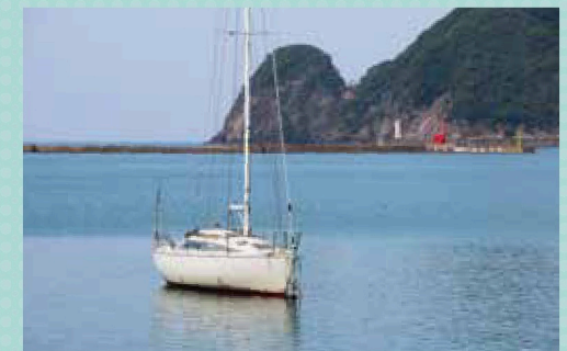
柴山湾沿いに歩道を歩くと、シャッターチャンスが次々現れる。