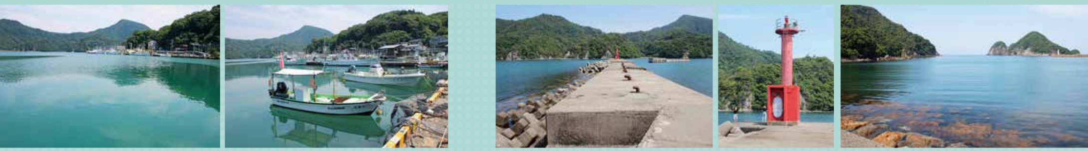
沖浦の漁港：大きな柴山湾の中に、更に奥へくびれた静かな漁港。小型の船が多く停泊する。→ 赤灯台：沖浦の漁港を道なりに行くと、まっすぐ伸びた突堤の先に赤灯台がある。広がる日本海を眺めながら釣りも楽しめる。ここで折り返し。