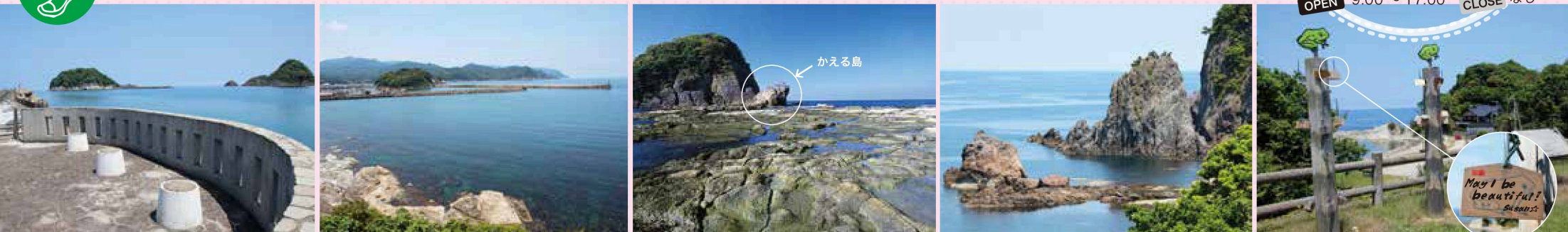
ふれあいデッキからは「白石島」などの島々と海の対比が美しい。→「一本松」交差点からは、車も走る県道だが、高い位置から眺めが楽しめる。いくつかカーブを曲がれば、カエルにそっくりなかえる島のある今子浦海岸。→切り立つ岩石が作る唯一無二の眺め。