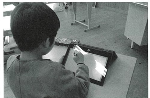
▲タッチペンを使って図形もスムーズに

昨年度、町内の小中学校で使用しているタブレット端末を一斉に更新しました。令和2年度の導入から5年が経過し、子どもたちの活用の幅が広がってきたこともあり、より高性能なタブレットに更新しました。今回の端末は、これまでのタブレットタイプから、キーボードと一体となった「コンバーチブル型」を採用、CPUの向上やメモリも増強し、動作の快適さが向上しました。また、本体に充電機能付きのペンが格納されていますので、図画工作のデジタルアートや数学の図形問題などがスムーズに行うことができます。最新の文房具として、子どもたちの学びを支えます。