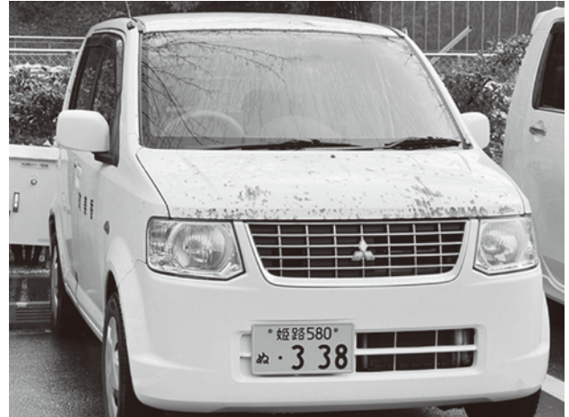
部分塗装しない方がおかしいでしょう？

病院の業務予定量が低下している中で、いかに地元で愛される病院を目指すかというところを考え