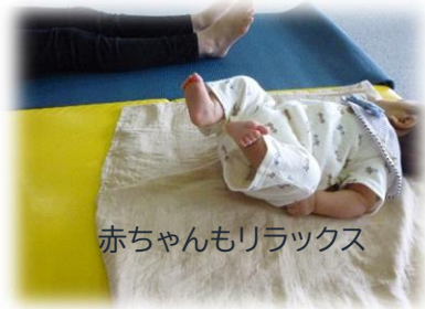
赤ちゃんもリラックス