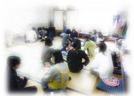
ヨガ終了後、ママカフェにて座談会。 (自由参加です)