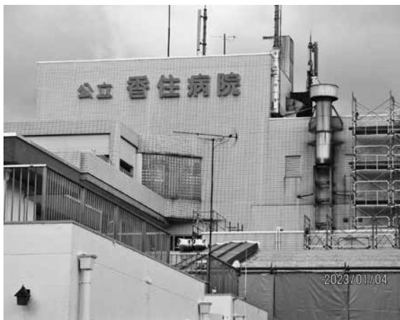
発熱は、早期の検査を

① 町の把握している直近 ② コロナ対策を伺います。 ③ 安定ですが、町としての コロナ感染の状態が不安 定ですが、町としての コロナ対策を伺います。