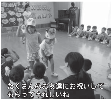
たくさんのお友達にお祝いしてもらってうれしいね