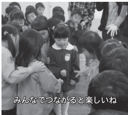
みんなでつながると楽しいね