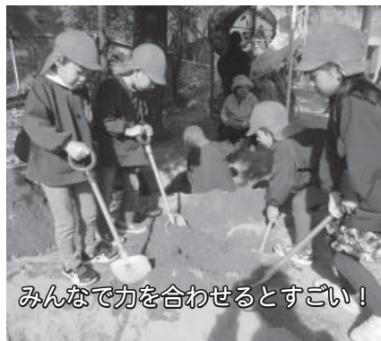
みんなで力を合わせるとすごい！