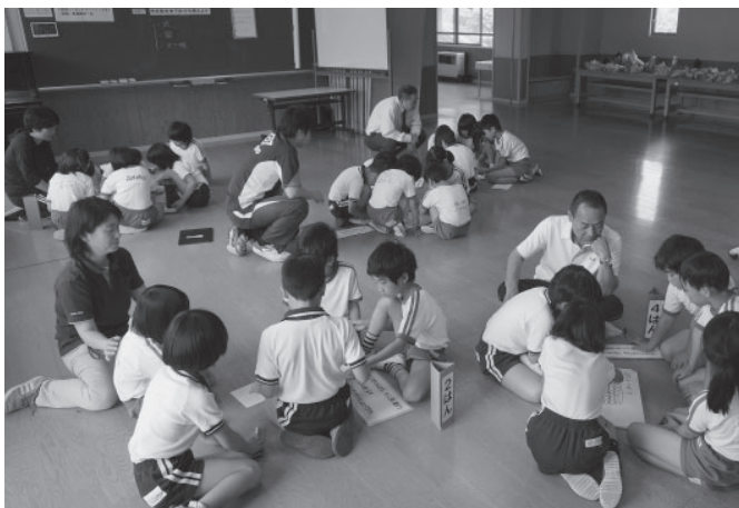
▲学校間スーパー連携チャレンジプランの様子

また、本町の学校園は、ほとんどが小規模校ですが、小規模の特色やよさを生かし、「学校間スーパー連携チャレンジプラン（学力向上ステップアップ授業、就学前わくわく交流会）」など、本町ならではの魅力ある学校園づくり