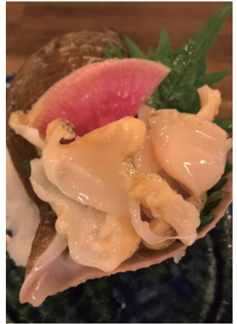
▲コリコリとした食感のアカバイの刺身

「アカバイ」？「アカ ガイ」？ 底引き網漁が行わ れるこの時期、柴山 港、香住漁港で水揚げ される「アカバイ」（正 式名称はエゾボラモド キ）は、巻き貝でコリ コリとした食感が特徴 です。しかし、香住で なじみの深いこの「ア カバイ」を、私は東京 で見ることがありませんでした。 この「アカバイ」を漢字で書くとな ぜか「赤貝」と書くそうです。東京で「赤 貝」と言えば、身の色が赤い二枚貝の