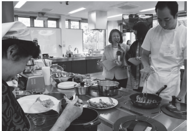
▲趣向を凝らした調理をする参加者

栄養豊富な香住の魚を使ったレシピを広く PR し、町の認知度を高めようと「第 3 回香住の“ひもの” de 料理コンテスト」（同実行委員会主催）が開催されました。