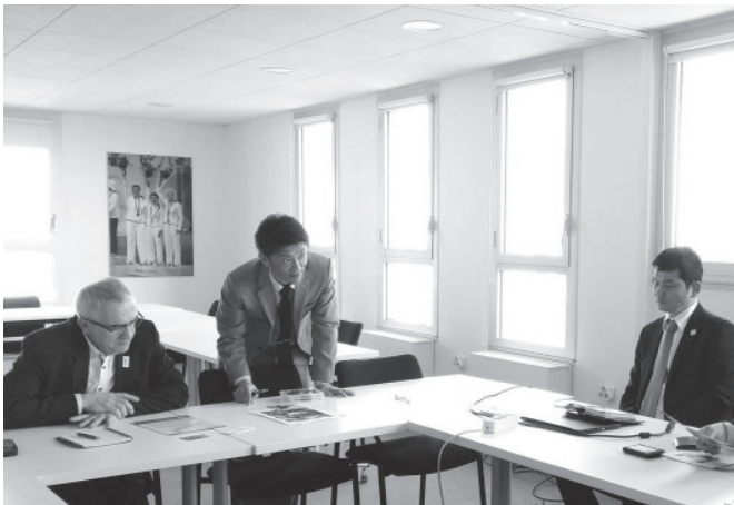
▲フランスアーチェリー連盟に本町の環境や練習場所を説明する様子

訪日外国人の増加に伴い、全国的に国際スポーツ交流の取組が行われていますが、内閣官房大会本部において、2020年東京オリンピック・パラリンピック競技大会の開催に向け、参加国・地域との人的・経済的・文化的な相互交流を図る地方公共団体を「ホストタウン」として認定し、全国各地に広げていく取組が行われています。現在、全国で270件、340団体