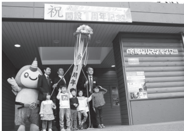
▲1周年を記念してくす玉割をする関係者の皆さん

余部クリスタルタワーの1周年を記念して『『空の駅』余部クリスタルタワー 1周年記念式典』（同実行委員会主催）が開催されました。