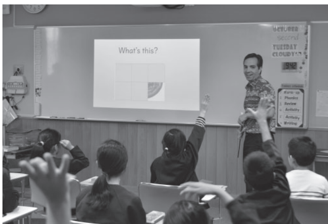
▲小学校で外国語活動を行う様子

小学校では2020年度から、また中学校では2021年度から、新しい学習指導要領による教育が全面实施さ