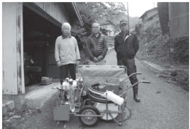
▲新しく購入した軽可搬消防ポンプ