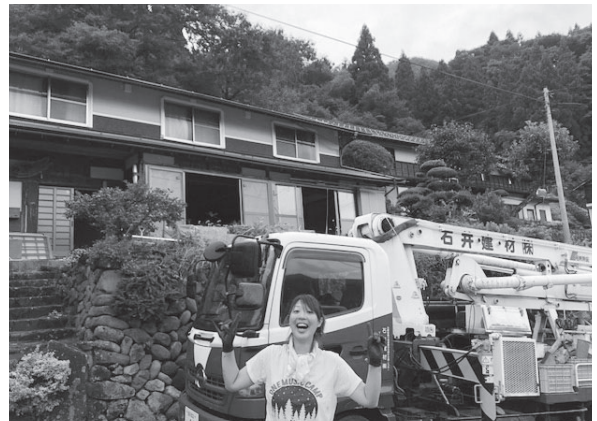
▲4月に本オープンを目指して準備中のスミノヤゲストハウス

私はこの町が好きです。お年寄りが多く、人も減っているという現状があるこの町。ゲストハウスを作って、UターンやUターンなど小代に人を増