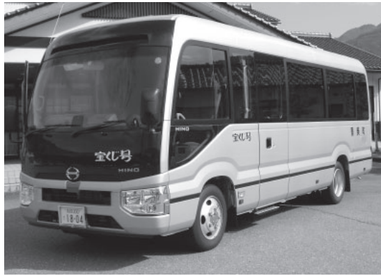
▲更新された生きがい活動支援通所事業用マイクロバス