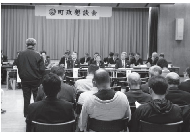
▲質問をする参加者

A 現在、役場の中堅職員8人で町民が利用しやすく、現状より利用者が増えるよう、「バス」という概念を取り払った公共交通体系についての検討をさせています。できるだけ町民の皆さんに利用していただけたらと思います。(町長)