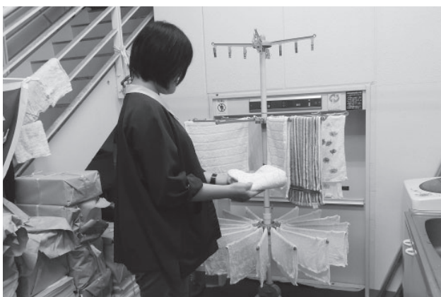
▲交換したタオルを洗濯する様子

燃えるゴミや燃やさないゴミなどを分別して袋詰めにし、ゴミの集積倉庫に運ぶ ・1階と2階のトイレ清掃 ・玄関の掃き掃除など です。午後からは、 ・交換したタオルの洗濯 ・3階と4階の床のモップ掛け ・階段の掃き掃除や手すりのぞうきん拭きなど を行っています。