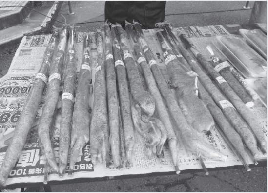
▲粘り気が強く独特の風味が評判の村岡で生産される自然薯

●自然薯の特徴 ①葉の形が細長いハート型 ②秋になると、葉の付け根部分にムカゴをつける。 ③芋の地下部分は秋に肥大するが、冬に地上部が枯れ、春になると芋の先から新たな芽が伸び、5年くらいかけて成長を繰り返して1mほどの大きく長い芋となる。 ※ムカゴ：ムカゴはナガイモや自然薯などのヤマノイモ属のつるになる肉芽のことで、秋になるとつるの葉の付け根辺りにたくさん付き、地下の芋と同じく貴重な山の幸として食用になります。