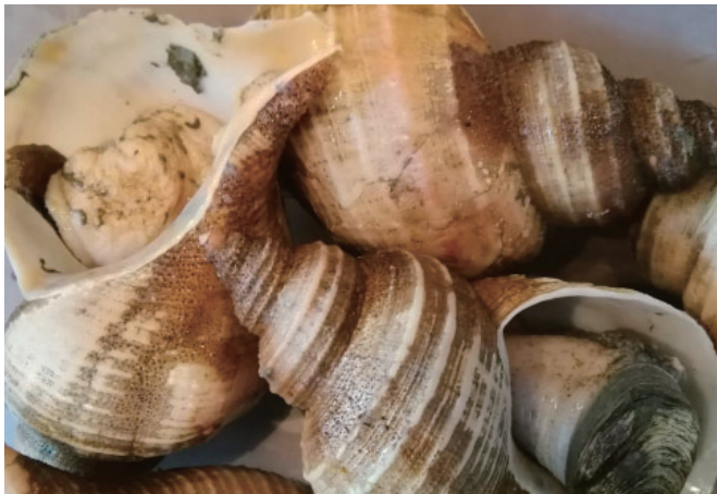
▲香住ではなじみの深い「アカバイ」

地元のおいしい魚を皆さんに食べてもらいたい、町内外に魚食普及を広く発信したいと思 い、入隊した新人隊員です。よろしくお願いします！