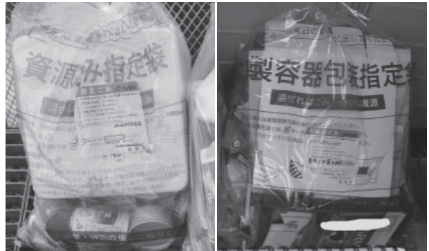
▲分別が適正にされていないごみ ▲指定袋を使用していないごみ

※「不適正ごみシール」が張られたごみ袋は、不適正ごみシールに×印をつけて再利用することができます。