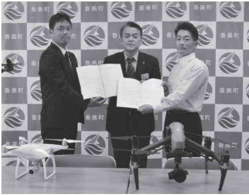
▲協定を締結した事業者と浜上町長