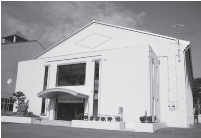
▲大規模改修工事を行った香住第二中学校体育館

文化施設の整備については、昭和45年に竣工し老朽化が進んだ香住文化会館の建て替え整備に向け、現在、基本設計および実施設計を行っています。