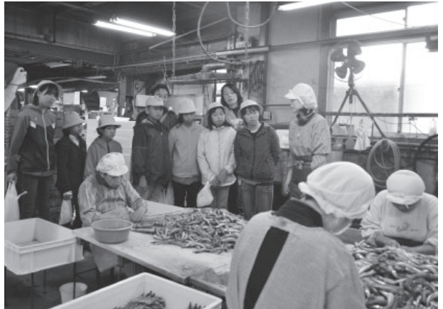
▲水産加工場を見学する余部小学校の児童

10月の「香美町魚食普及月間」の一環として、香美町とと活隊が「魚を知ろう～魚の学校～」を開催しました。