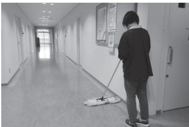
▲床のモップ掛けをする様子

燃えるゴミや燃やさないゴミなどを分別して袋詰めにし、ゴミの集積倉庫に運ぶ ・1階と2階のトイレ清掃 ・玄関の掃き掃除など です。午後からは、 ・交換したタオルの洗濯 ・3階と4階の床のモップ掛け ・階段の掃き掃除や手すりのぞうきん拭きなど を行っています。