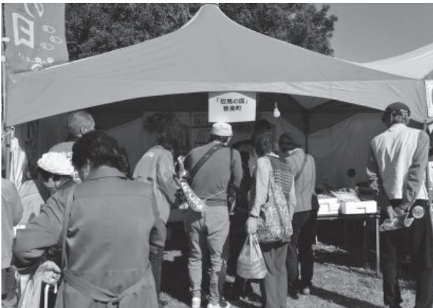
▲香美町の産品を買いに訪れる来場者

兵庫 5 カ国交流会議（猪名川町、篠山市、淡路市、播磨町、香美町）の特産物などの販路開拓を目指そうと「ふるさと産品交流事業」が播磨町の「第 28 回大中遺跡まつり古代村市場」で開催されました。