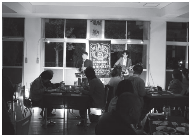
▲ジャズや洋楽の演奏を楽しみながら食事をする来場者

施設の有効活用を図ろうと旧村岡中学校のうづかの森で「2018Autumn うづかの森 bar」が開催されました。