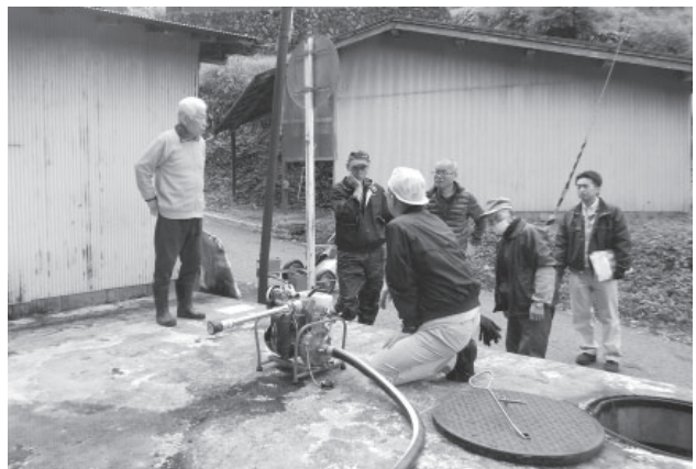
▲操作説明を聞く野間谷区の皆さん