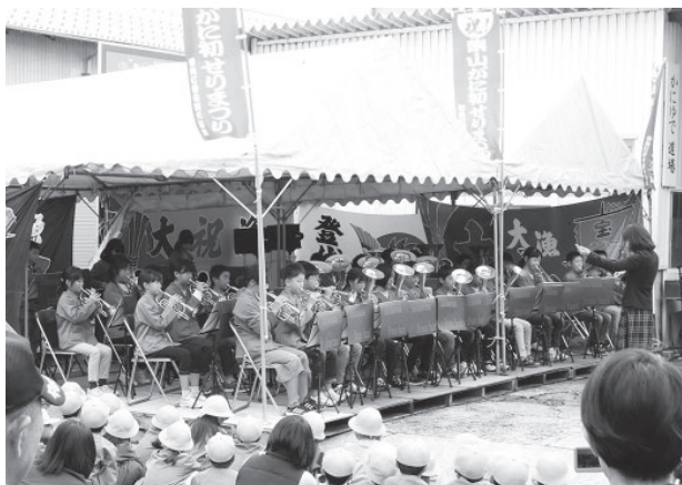
▲大漁を願い演奏をする柴山小学校金管バンドクラブの皆さん

11月6日に解禁となったズワイガニ漁の初せりを祝い「祝！柴山がに初せりまつり」（同実行委員会主催）が開催されました。