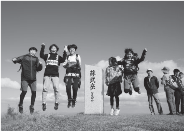
▲新しく立てられた石柱で記念写真を撮る参加者

蘇武岳の紅葉を見ながらハイキングをしようと村岡区中央公民館などが「蘇武岳紅葉ハイキング」を開催しました。