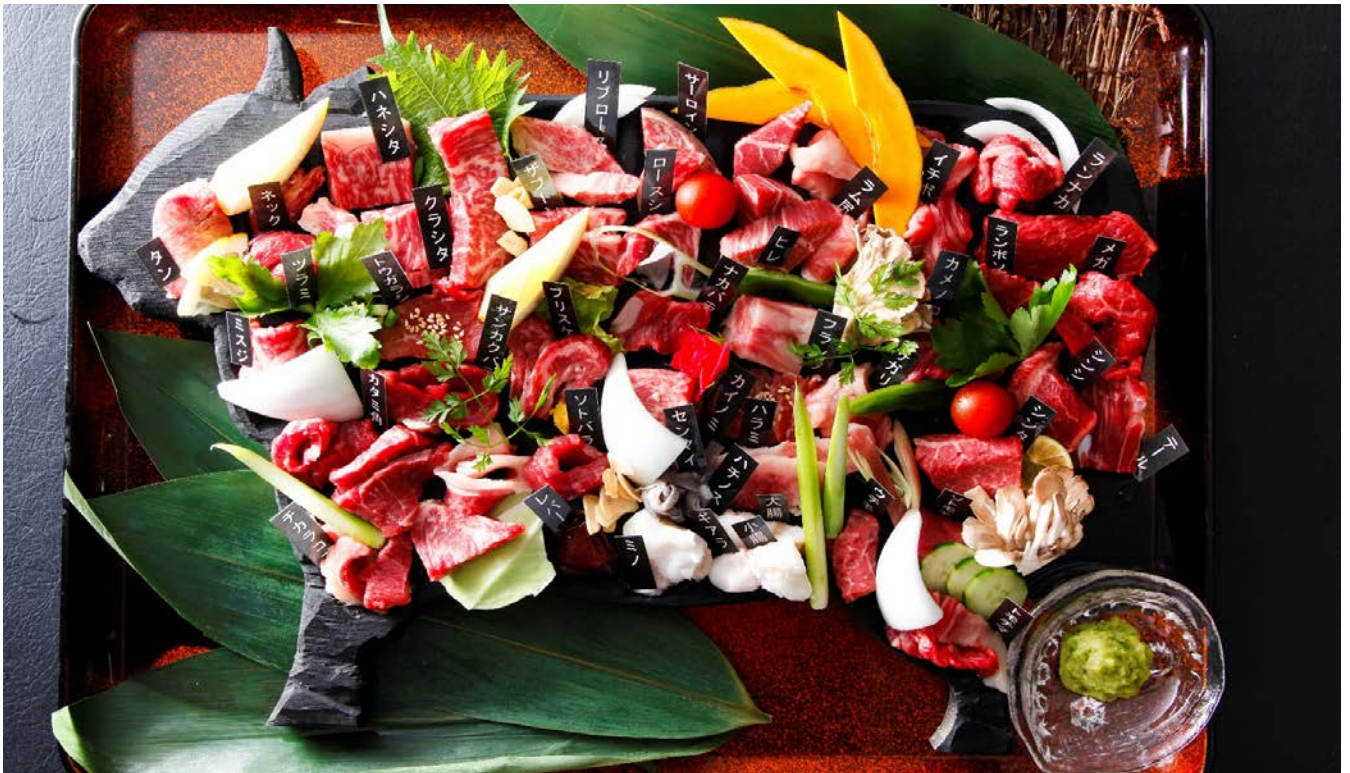
※但馬牛一頭丸食いコース（2人前イメージ）

おそらく世界でここだけでしょ!? 目玉はなんと「但馬牛一頭丸食いコース」!! 但馬牛の全部位41種を食べ尽くす新発想のプレミアムバーベキューです!!