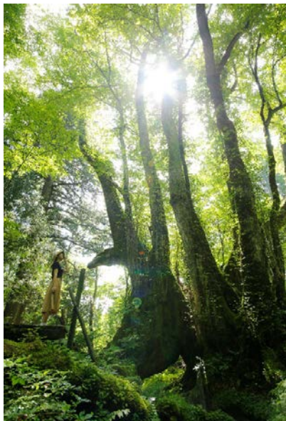
植物園のシンボルツリー「和池の大かつら」