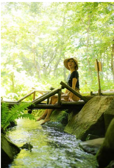
かつらの千年水で足湯ならぬ足水。