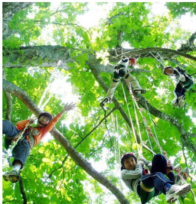
大人も子供も空中散歩。非日常の木登り。ツリーイング(イメージ)