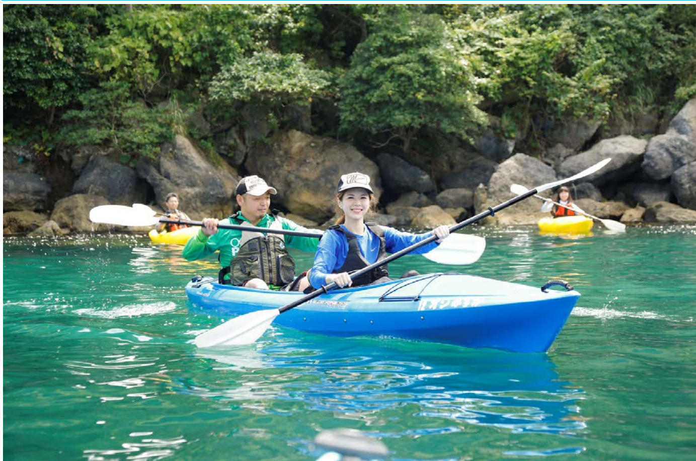
山陰海岸ジオパークの美しい大海原へ漕ぎ出そう！シーカヤック(イメージ)

海がキシイ。山がキシイ。川がキシイ。ロケーションも最高。 ～キシイがハンパない。香美町の大自然を満喫するピカピカの夏～