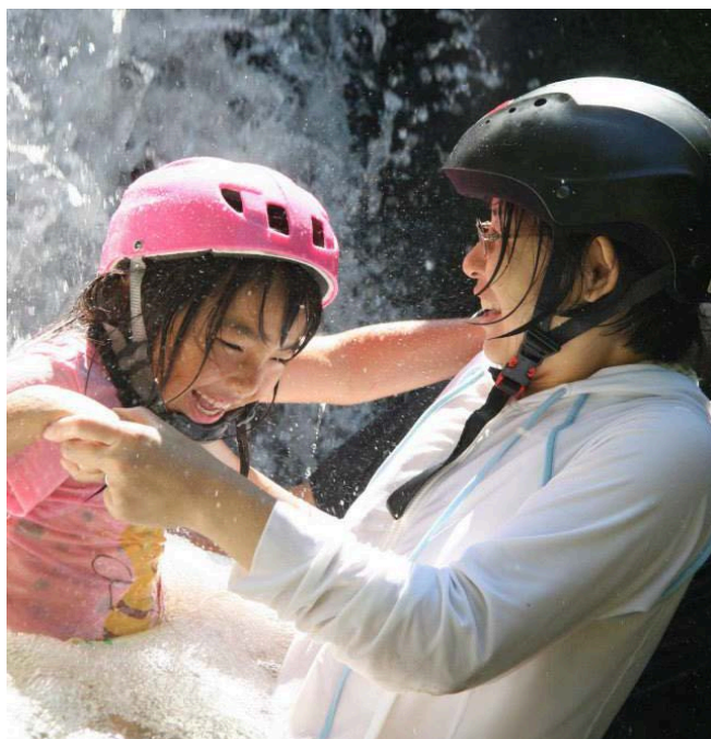
親子で思いっきりはしゃごう！シャワークライミング(イメージ)