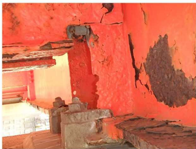
主桁に腐食が見られます