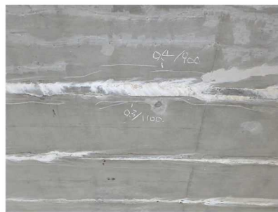
主桁にひび割れが見られます