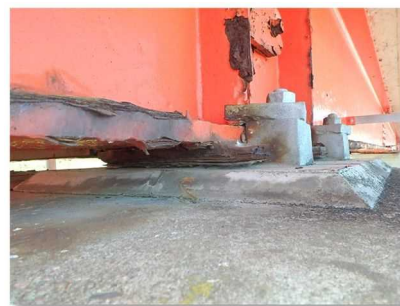
支承に腐食が見られます