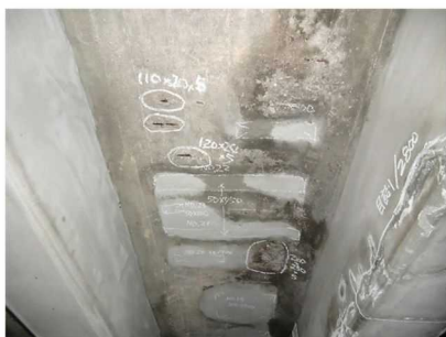
床版に剥離・鉄筋露出が見られます