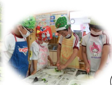
たのしくクッキング