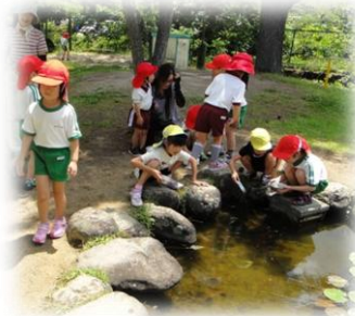
池で遊ぶ子どもたち