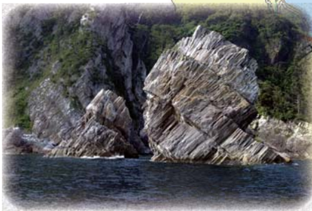
▲インディアン横顔にそっくり「鷹の巣島（インディアン島）」