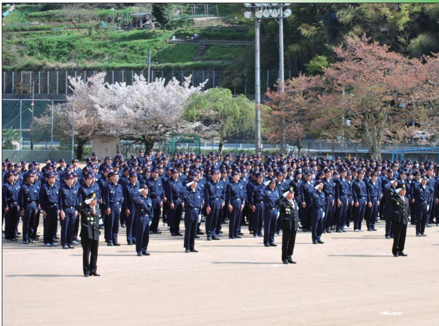
【写真】 安全・安心なまちを目指して 香美町消防団出初式