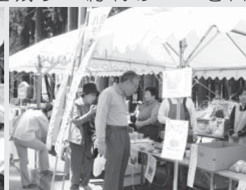
▲大盛況の特産品販売コーナー