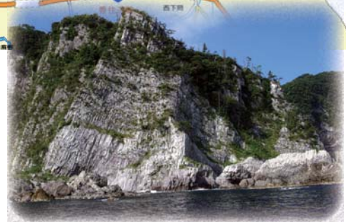
▲国指定天然記念物「鎧の袖」