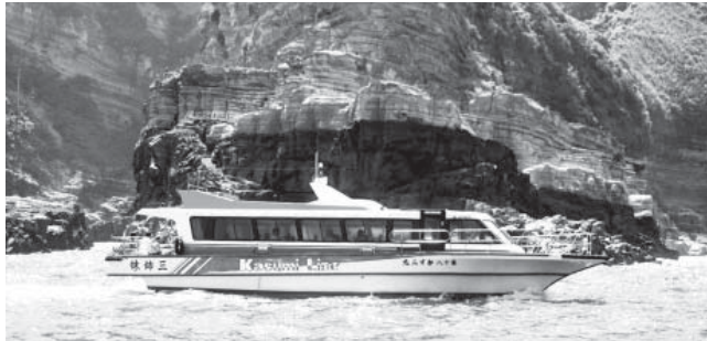
▼名勝、奇岩をめぐる遊覧船

昨年12月に地質公園「日本ジオパーク」に認定された、山陰海岸（香住・浜坂間）を巡る遊覧船の特別運航を、4月から6月の3カ月間、期間限定で行っています。