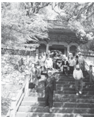
▼大乗寺を訪れる観光客

5月3日から5月6日までの4日間限定で、特別イベントとして1階案内コースに加え、普段非公開の2階「猿の間・鴨の間」が公開されました。