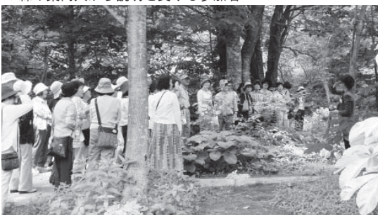
▼森の案内人から説明を受ける参加者

静川平の自然をそのまま生かしながら、四季の草花や樹木を楽しめ、庭好きにはたまらないスポットとなっています。