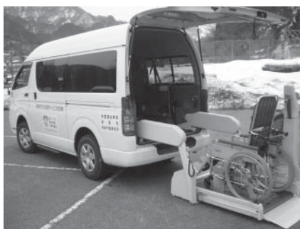
▲車いすのままリフトで持ち上げます。

町では、(財)自治総合センターによる宝くじ販売の収益金を財源とした「共生のまちづくり助成事業」の助成金を受けて、リフト付自動車を購入しました。