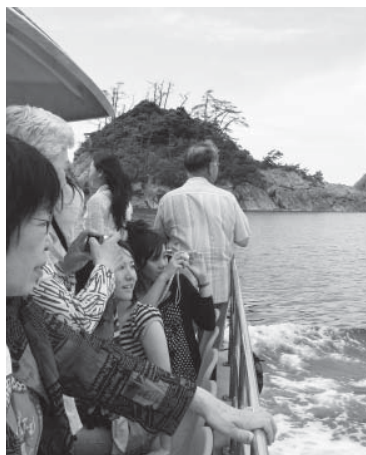
▲遊覧船で海岸美を楽しむ観光客

今年4月から6月にかけて、兵庫県では、全市町、観光関連団体、経済団体、JRグループなどが連携し、県内の魅力を全国に発信・周知し、観光客を誘致する大型観光交流キャンペーンを行います。 これに伴い、香美町内では次のような特別イベントを開催。多くの観光客をお迎えし、香美町の魅力を大いにPRします。