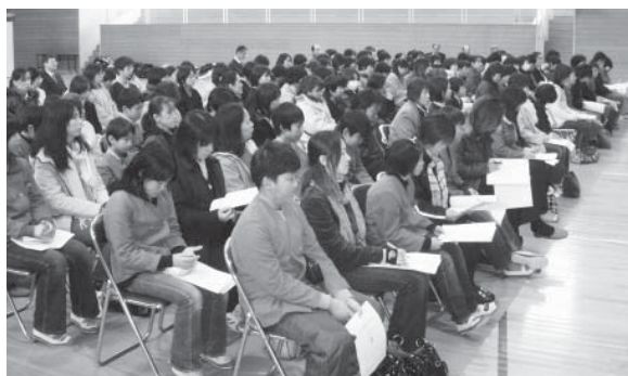
▲入学説明会の様子

2月9日に、村岡中学校入学予定の3小学校の児童と保護者に対して入学説明会を行いました。中学校生活と小学校生活の違いや服装、持ち物、部活動の種類、通学方法と補助金などの説明を行いました。児童は、担当教師の説明を神妙な面持ちで聞き入っていました。また、保護者からは生徒の服装や持ち物などについて、詳しい説明が求められました。