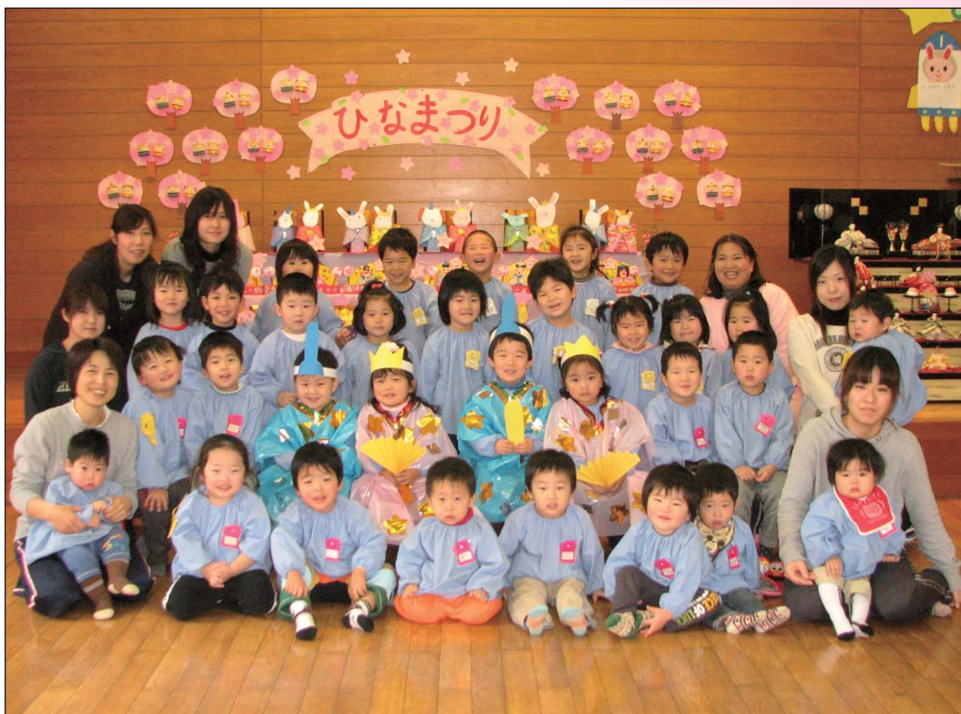
【写真】♪今日は楽しい ひなまつり♪ 柴山保育所 “ひなまつりの会”