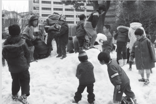
▲思い思いに雪と戯れる子どもたち

長年交流を続けている尼崎市で2月11日、「第17回ふるさと雪まつり(同実行委員会主催)」が開催され、香美町からの白い贈り物「雪」をプレゼント。これは、同市と交流を始めた旧美方町の頃から毎年行っている取り組みで、今回は、小代区久須部のふれあい歴史公園周辺で積み込み、10tトラック2台で運んで行きました。