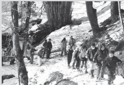
▲兎和野の大カツラ周辺にて

木の殿堂(村岡区和池)で2月15日、スノーシュー(西洋かんじき)を履いて森を散策する「スノーシューで雪山を歩こう」が開催され、町内外から22名が参加しました。同施設の職員にスノーシューの履き方、歩き方などを教わった後、参加者は早速、雪の積もった木立の中へ出かけました。