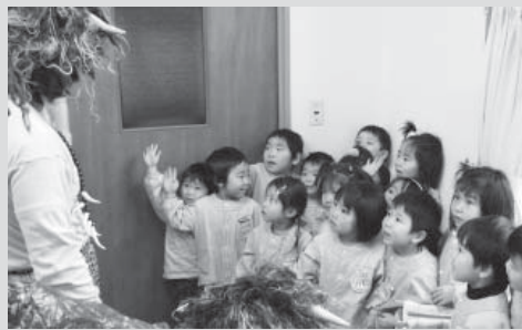
▲「いい子になるか」と言われ、思わず手を上げる園児も

みたと保育園で2月3日、節分の豆まきが行われました。同園の保護者会役員が変装した赤、青、ピンクの鬼が教室に突然現れ、「悪い子はごた、言うことを聞かない子はごた」と叫びながら園児を追いかけました。驚いた園児は、泣きだしたり、教室の隅に逃げたり。すっかりおびえた子どもたちは豆を投げるのを忘れてしまっただけでした。