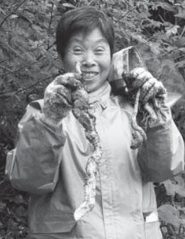
▼苦勞して掘り出した自然薯

昼食には小代区いずみ会の皆さんが用意してくれた秋野菜たっぷりの豚汁とおにぎり、地元で採れたキノコ汁をいただき、参加者は心も体もポカポカに温まりました。