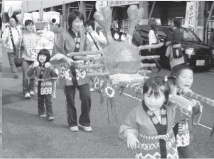
▼カニみこして盛り上げる柴山保育所の園児

松葉ガニの初せりを迎え、活気あふれる柴山港で11月6日、祝！かすみ松葉ガニ初せりまつりが開催されました。