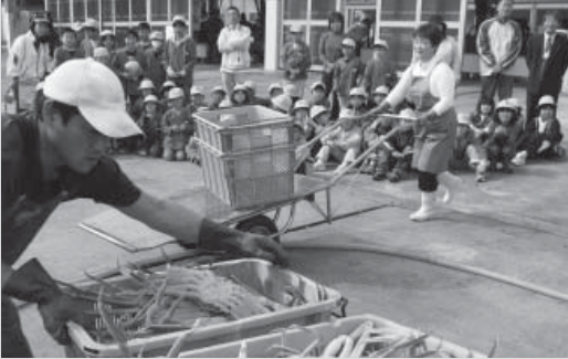
▼地元柴山小学校の児童が見学

柴山港での初せりのオスガニの最高値は80210円で、漁獲はオス約1・55t（約1500万円）、メス約2・35t（約837万円）でした。