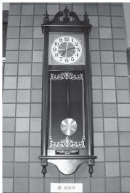
▲調印の記念に吹田市から贈られた柱時計(役場本庁舎香美ホールに設置)

職員は、地方公務員法により、営利企業などへの従事が制限されています。ただし、任命権者の許可を受けて営利企業などに従事することが認められています。第3セクターの役員に就任する場合などがこれにあたります。