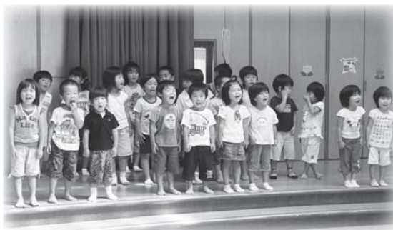
▲敬老交流会で歌を披露 (小北へき地保育所)

各保育所(園)では、5歳児まで(小学校に入るまで)のお子さんを保育しています。 保育時間は通常、午前8時から午後4時までですが、早朝や夕方の延長保育も行っていきます。 就業や介護などご家庭でお子さんを保育できない場合はご利用ください。