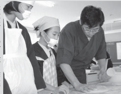
▲手ほどきを受ける児童の表情も真剣

11月14日、ふるさとの素晴らしさを感じてもらおう「ふるさと学習」の一環として、射添小学校の6年生12人が、自分たちで育てたそばの実で、そば打ち体験を行いました。