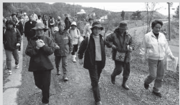
▲いろいろな秋を発見できた散策コース

カエデやもみじが赤や黄色に色づき秋まっさかりの11月9日、標高750mの美方高原自然の家周辺（小代区新屋）で本年度最終となる公民館連携ふるさと語り部講座「秋を満喫する」が行われ、子どもから大人まで約50人が参加。散策コースと自然薯掘りコースに分かれて秋の一日を楽しみました。