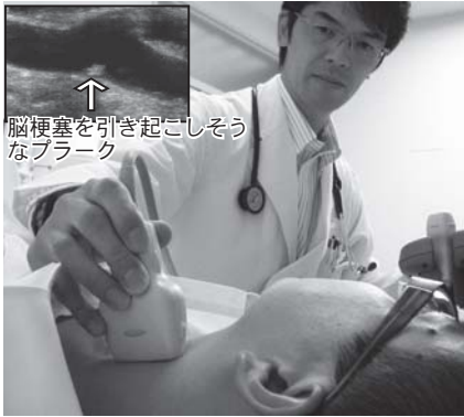
▲所要時間は10～20分間程度と手軽な検査

呼ばれる棒でなぞるだけで、痛みなどはありません。頸動脈や椎骨の動脈がプラークにより詰まったり流れづらくなつていないか、逆流がないかなどを調べます。また、頸部血管エコーは、狭心症、大動脈瘤、閉塞性動脈硬化症などの補助診断にも役立てられています。 プラークは、放っておくと年間約9%の割合で大きくなると言われています。早期に動脈硬化を発見し、薬や生活改善などの適切な治療を行いましょ。 検査費用は、1000円程度（保険適用で3割負担の人の場合）です。