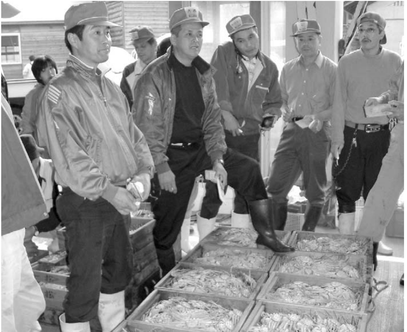
▲松葉ガニ解禁日 初せり〈香住町〉(H16.11.6)

第18回合併協議会が11月11日、香住町国民宿舎ファミリーイン今子浦で開催されました。また、合併に伴う手続きについても掲載しています。