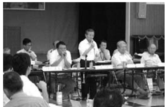
▲第10回合併協議会の様子