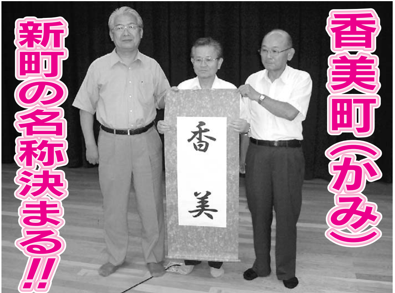
▲第12回合併協議会（7月28日）

第12回合併協議会が7月28日、村岡町老人福祉センターで行われ、協議の結果、全会一致で新町の名称が「香美町」に決まりました。「香り高く、美しい町」という意味をもち、町民の心よりどころとなるとともに、町の発展に期待が込められています。詳細については、次号（第8号）において掲載します。なお、2ページ以降は7月14日までの内容を掲載しています。